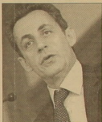
Նման եկևորային արթնություն Ֆրանսիայի 5-րդ հանրապետության դաշնության մեջ եղել է միայն 1993-ին՝ վարչապետ Էդուար Բալադուրի և նախագահ Ֆրանսուա Միտերանի երկրորդ համակցության ժամանակահատվածում:

«Վայր ակայություն» արթնությունը այսօր հրապարակում է հերթական ամենամսյա հարցման արդյունքները, որոնց համաձայն Ֆրանսիայի նախագահ Նիկոլա Մարկոզի վարկանիշն իջել է անախադեպ 33 տկոսի: Մինչդեռ վարչապետ Ֆրանսուա Ֆյոնը վերջին մեկ ամսում 6 տկոս ան է արձանագրել, նրա գործունեությանը հավանություն է արվել Ֆրանսիացիների 55 տկոսը: