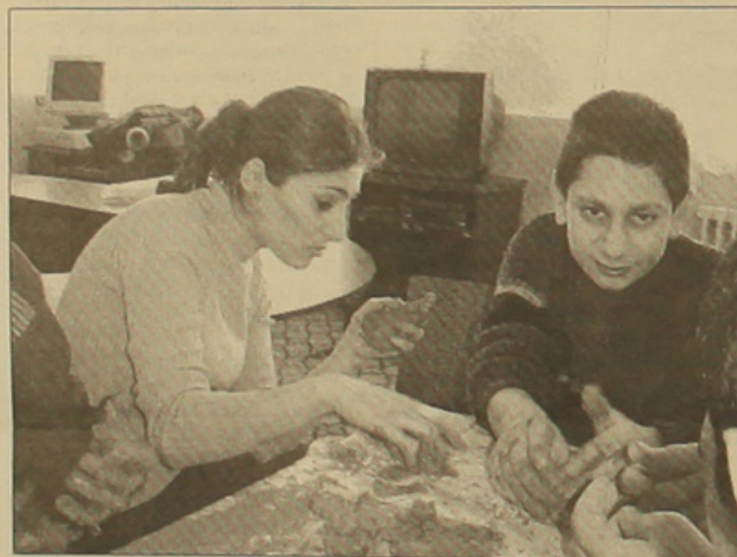
Ռաֆայելը կավագործությամբ զբաղվելիս