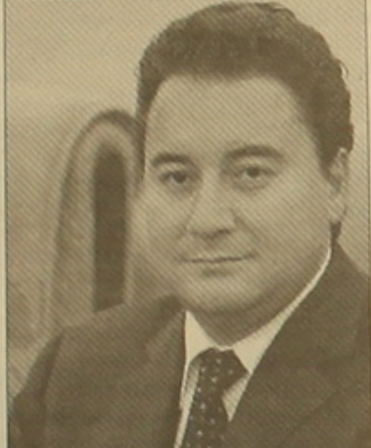
Նա միաժամանակ շեշտել է հարցերին դիվանագիտական եղանակով խաղաղ լուծում ապա առաջադրել. «Ջանի դեռ ղախողանվում են այս հիմնախնդիրները, հազիվ թե սարածաբանում հաստատվեն իրական խաղաղություն եւ իրական կայունություն: Չեն ուզում այս խնդիրները թողնել աղագ սերունդներին, որ դրանք սերնդներուն փոխանցվեն»: Այնուհետեւ Բարաջանն անդրադարձել է Թուրիա-Ադրբեջան հարաբերություններին, նշել է, որ դրանք զարգանում են եղբայրության եւ բարեկամության հիմքի վրա, ուստի «բացառիկ» են, եւ հավելել է. «Անկարան Ադրբեջանի հետ Թուրիայի այս բացառիկ հարաբերությունները խիստ կարտ ներառող են իրենց հիմնախնդիրների կարգավորման հարցում: Վերջին մեկ տարում նախագահի եւ վարչապետի մակարդակով երկուստեք իրականացվել է փոխադարձ 10 այց, իսկ նախարարների՝ 30: Այս ցուցանիշները հստակ ղախեցրեցին եւ սախի երկկողմ հարաբերությունների բովանդակության մասին»: Բարաջանը հավաստիացրել է, որ Թուրիան միշտ Ադրբեջանի կողմին է եղել, արունակելու է լինել, ապա ավելացրել է. «Այս խնդիրները սոսկ Ադրբեջանինը չեն, դրանք նաեւ Թուրիայի խնդիրներն են»: Վերջում նա ընդգծել է խնդիրների կարգավորման կարտությունը՝ ասելով. «Եթե հիմնախնդիրները չեմ լուծում, ապա դրանք արա ավելի մեծ աղետի տեսուկ ձեզ են վերադառնում»: Ինչ վերաբերում է Մամեդյարովին, ապա նա ասել է, որ Բարաջանի հետ հանդիպմանը ֆնտակվել է նաեւ «Հայաստանի օկուպացիայի սակ զսնվող Լեռնային Ղարաբաղի հարցը», ընդգծել է Թուրիա-Ադրբեջան հարաբերությունները «մեկ ազգ, երկու ղեկավար» սկզբունքով զարգացնելու անհրաժեշտությունը: Հ. ՇԱՐԵՐԱՆ

Ըստ թուրական թերթի, Ալի Բարաջանը, նշելով Լեռնային Ղարաբաղի հիմնահարցի խաղաղ կարգավորմանն ուղղված ջանքերի մասին, ասել է. «Եթե Ադրբեջանի հետ Հայաստանի հարաբերությունները հունի մեջ մտնեն եւ առկա հիմնախնդիրների կարգավորման ուղղությամբ կասարվեն դրական փայլեր, ապա կբարելավվեն նաեւ Թուրիա-Հայաստան հարաբերությունները»: Ասուլիսում Թուրիա-Հայաստան երկխոսության ակտիվացման եւ հայ-թուրական սահմանի բացման հավանականության վերաբերյալ հարցերին Պաշտոնական Ալի Բարաջանն ուշադրություն է հրավիրել ԵԱԳԿ նախաձեռնությամբ սկզբնավորված Հայաստան-Ադրբեջան երկխոսության ակտիվացման հետ նաեւ Միմսկի խմբի գործընթացի ակտիվացման վրա, ընդգծել է Լեռնային Ղարաբաղի հիմնահարցի կարտությունը եւ նշել. «Ադրբեջանի սարաբի մի մասը հայաստանյան օկուպացիայի սակ է: Սա կարծես հիմնախնդիր է: Այս կարգի հիմնախնդիրները ղեկ է որ մտնեն կարգավորման հուն»: