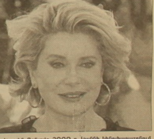
Կասրին Դընյովը 2000 թ. Կաննի կինոփառատնում

«Կասրին Դընյովը երբեք չի խաղում խաղի կանոններին համաճարհայն: Նա երբեւ չի խաղացել որեւէ կանոնի համա-