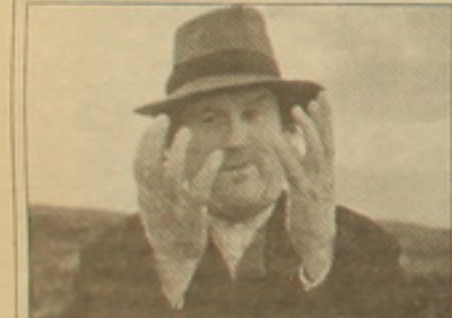
Կարլ «Ինչպես Գորիոն ծառ դարձավ» ֆիլմից

Իոլանդիայում 2001-ին նա նկարահանել է իր «Ինչպես Գորիոն ծառ դարձավ» այլաբանական ֆիլմը՝ անհանդուրժողականության մասին: Այժմ նա այդ երկուսն էլ վերանկարահանելու համար 1980-ի սեւ կասակեղբայրությունների ժանրին դասակարգելով «Գառնակ վերաբերում» ֆիլմը, որը դասում է սրբախառնի հիվանդների և նրանց բնակալ թերապիայի մասին: Գիվանդներից մեկի դեր կատարում է իոլանդացի դերասան Կոլմ Սիմոն, որը նկարահանվել էր նաև նրա «Նախորդ» «Ինչպես Գորիոն ծառ դարձավ» ֆիլմում: «Գորիոն» լավ ընդունվեց վեներիկի կինոփառատոնում: