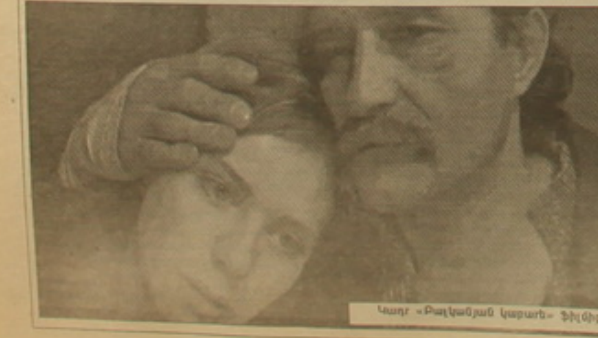
Կարլ «Բալկանյան կարար» ֆիլմից

Սերբոլիցիներում կազմակերպված այս ցուցադրումներով ու «Գառնակ վերաբերում» ֆիլմը վերանկարահանելով Պատկերասրահը հույս ունի նոր հերիզումներ քաջել «Սերբալի» վերագրված սերբաբանական համատեղ արտադրության նոր ֆիլմ ստեղծելու համար: «Բայց միջև այդ լիցի է ստանալ սեռելու, թե ինչ է սերբի ունենալու Կոսովոյում: Ի վերջո, մեծ լիցի է ի վիճակի լիցի միայն ապրելու», եզրակացնում է նա: