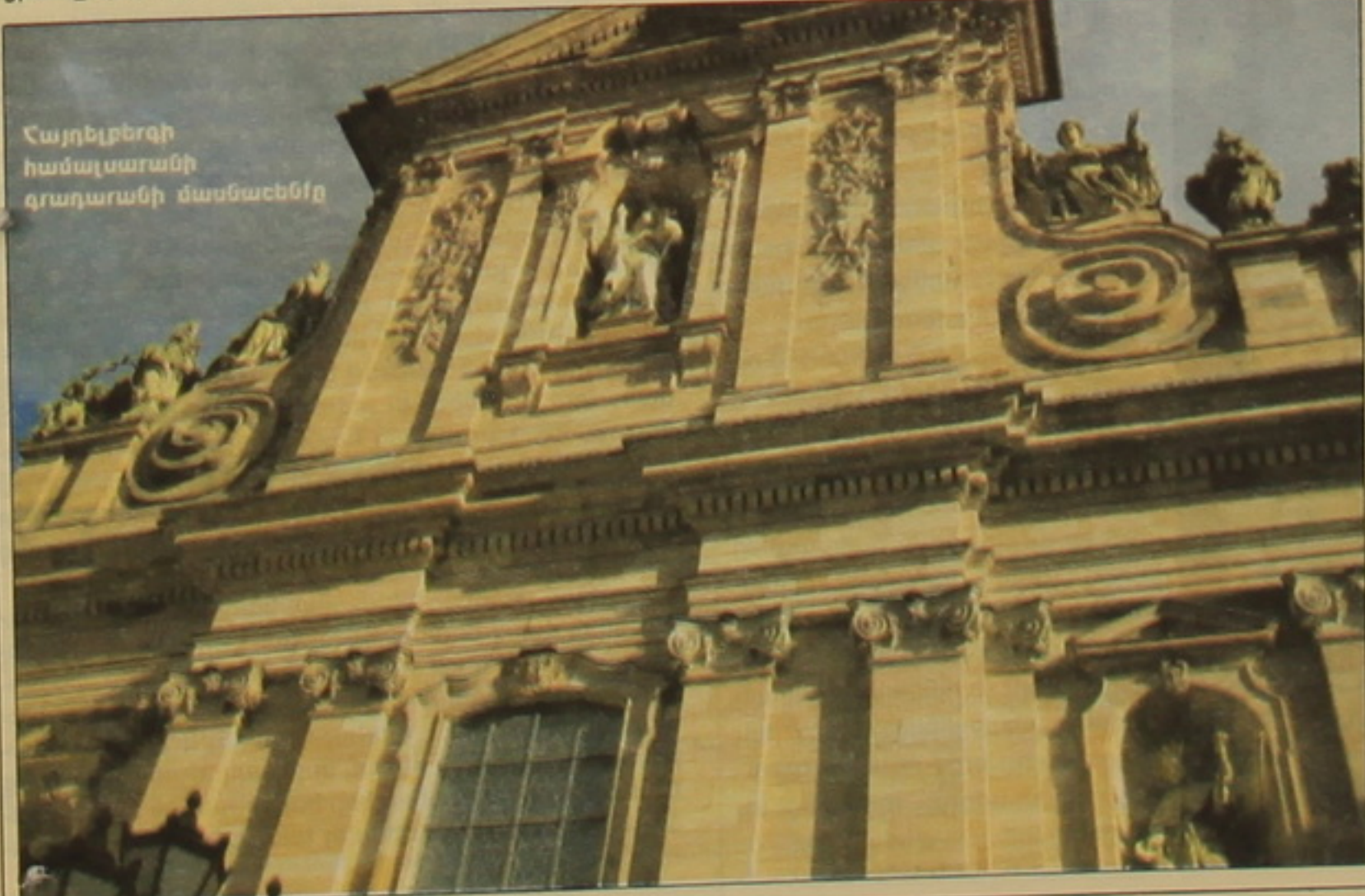
Հայտելերգի համալսարանի գրադարանի մասնաշենք

WEINIG, WACO, GRECON, DIMTER, RAIMANN, CONCEPT WWW.WEINIG.COM