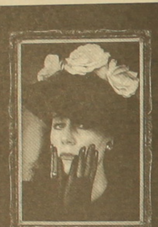
ԱՆԱՀԻՏ ԹՈՎՄՅԱՆ ՄԻՅԵՆԻ ՇՈՅԵՐԻ

դականությունը հասնել է միայն վարձի գրողին: Ես դարձա Անահիտ Թովմյանի ստեղծագործության հետևորդ, որովհետև նրան համարում են հայ բեմի, ինչպես նաև կինոյի հմայիչ դերասանուհի, հիացած են նրա գեղեցկությամբ և կնոջ ներքին աշխարհը բնուն ներկայացնելու ձիրով: Առանց չափազանցության կարող են համեմատել նրան ինժ համար սիրելի հոյակապ ասող Մերիլ Ստրիպին: Միայն թե Անահիտը ժամանակին Գոյիվոլը չի ընկել: