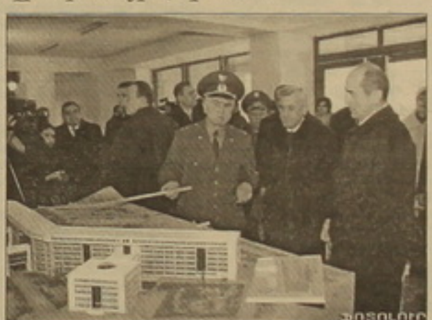
Տես իջ 8

ՆԱԹԻՆ ՍՈՒՐՅԱՆԸ Երեկ նախագահ Ռոբերտ Ջոլյարյանը այցելեց ԳԳ ՁՈՒ-ի գլխավոր արքրե, որտեղ աշխատանքային խորհրդակցություն անկացրեց դասառանության, արտաին գործերի նախարարությունների, Ազգային անվանագության ծառայության ղեկավար կազմի հետ: Լուսաղոմների հետ հանդիման ժամանակ Ռոբերտ Ջոլյարյանը նեց, որ մայիսի վերջին ավարտին են հասցվելու ԳԳ դասառանության նախարարության նոր արքրեի արձարարական աշխատանքները եւ նոր նախարարության արքրեի հանրադեռությունում լավագույններից մեկն է լինելու: Ջոլյարյանը են նաեւ Գաղախա- կան անվանագության յայմանագրի կազմա- կերպության անդամ յեռեռությունների զին- ված ուժերի Գայասանի արարեում «Ռո- բերտ-2008» համաեղ գորավառությունների նախադասուսական աշխատանքների ան- կվող հարցեր: