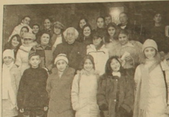
Հավաստիացնում են, որ մրցանակները բաշխվեցին ազնիվ կենտրոնացում: ԲՈՒՄԿ-ի կողմից անցկացված մրցումն ազնիվ էր, որ ինչպես մեզանց մեկը նկատեց, կարող է օրինակ ծառայել նախագահական ընտրություններում:

Բարե ձեզ: Այս անգամ մե՞ն «Ազգ»-իկներ, ձեզ ողջունում են ոչ թե մանկապատանեկան, այլ մեծահասակների «Ազգում»: Երեկ դասընթացի մեջ վերջին օրը հազարավոր եր քուստ իրադարձություններով՝ UNICEF-ի մեծ հաղթանակով նվաճված հյուրընկալեցին, ապա մե՞ն հյուրընկալեցին, անցկացրին մեծ այնպիսի աստիճանական կենտրոնացումը՝ որոշելով մեզանց «ամենամեծ լրագրողներին»: