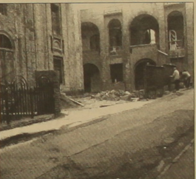
Մի Ավետարան Սուրբ Ասվածածին, Երեւանցոց Սուրբ Մինաս, Մուղեցոց Սուրբ Գեորգ հայկական եկեղեցիները Վիրահայոց թեմին վերադարձնելու հարցի փառաբանական քննարկումներում: Sbu էջ 2

ԱՐԱՆԻ ՀԱՐՈՒԹՅՈՒՆՅԱՆ «Հայ առաքելական եկեղեցու Վիրահայոց թեմը՝ ավելի քան 400 000 վրաստանական հայության անունից, իր մտահոգությունն ու վրդովմունքն է արտահայտում՝ Վրաց ուղղափառ եկեղեցու ներկայացուցիչների կողմից Թբիլիսիի Սուրբ Նորաբեն հայկական եկեղեցու եւ նրա հարակից սարածի դեմ կատարվող նոր ոստիկանական արձագանքների առնչությամբ», այսպիսին է Հայ եկեղեցու մտեցումը՝ վիրահայոց թեմի մամուլ դիվանի տարածած հաղորդագրության համաձայն: 15-րդ դարի Ա. Նորաբենը 20-րդ դարի 30-ական թվականներին, այլ կրոնական կառույցների հետ մեկտեղ, փակվել է հոգեւոր գործունեության համար եւ օգտագործվել որպես գրադարան: Վրաստանի ղեկավար անկախության վերականգնումից հետո էլ վրաց իշխանությունը չվերադարձրեց եկեղեցին իր օրինական, դասական սիրովը: Թե այս սարվա մայիսին ինչ էր նախաձեռնել վրացի ֆահիսա Թարիբն ու ուր էր հասել, «Ազգի» ընթերցողները տեղյակ են: Վիրահայոց թեմն արտահայտեց մտահոգություն ու վրդովմունք՝ կատարված որակյալ վրացական կողմի հետ թայմանավորվածության խախտում, որը ձեռք է բերվել Հայ առաքելական եկեղեցու եւ Վրաց ուղղափառ եկեղեցու միջեւ՝ Սուրբ Նորաբեն եւ Թբիլիսիի մյուս չորս՝ Սուրբ Նեան, Շամխրեցոց Կար-