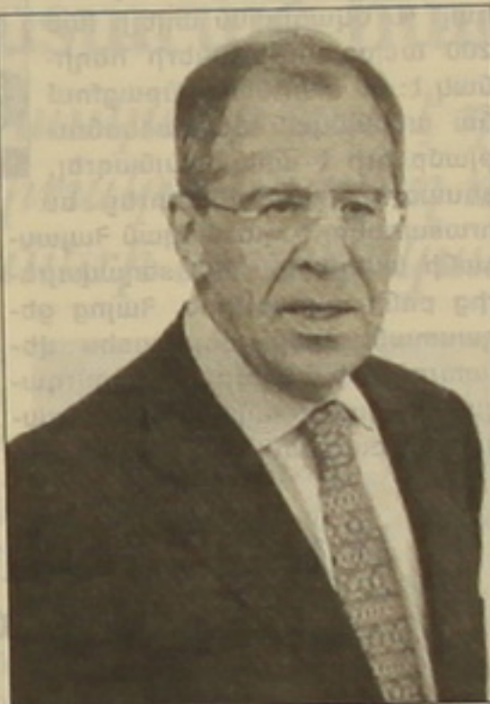
Բերությունների հաստատման միջոցով:

«Հայաստան, ըստ երկայն, օրջափակված է դարաբայան հակամարտության դասառոտով», «Ռոսիյսկայա զագետային» սված հարցազրույցում հայտարարել է Ռուսաստանի ԱԳ նախարար Մերգել Լավրովը: «Հայաստանը արտաին աշխարհի հետ Եվրոպան հարցում մեծ դժվարություններ ունի: Հայ ժողովրդի արմատական Եվրոպան է բխում այդ իրավիճակը հնարավորինս արագ արդարաբանակելը», գտնում է Ռուսաստանի արտաին գերատեսչության ղեկավարը: