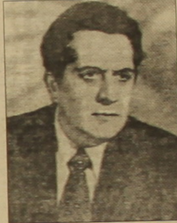
Մեծմեծերի 17-ին լրացավ նշանավոր հայ մաթեմատիկոս Ալեքսանդր Անդրանիկի ծննդյան 80-ամյակը:

Թալալյանի մանկությունն անցել է Երևանում: Ախուրյանի օրոհի Գեորգի Գեորգիան, իսկ դպրոցական օրոհը՝ Լեւոնակաճյան: Դպրոցում նրա գլխավոր նախադասությունը Պատմությունն էր, բայց ի վերջո մաթեմատիկայի ուսուցիչ՝ Դուսիկ Մելիք-Արամյանի ազդեցությամբ նա ընտրեց մաթեմատիկայի բնագավառը՝ Պաշտոններով առ այսօր խոր հետազոտություններ է կատարում: Չեզոք ուսումնառությունը Թալալյանը բարձրագույն է ԵՊՀ ֆիզիկա-մաթեմատիկական ֆակուլտետում: