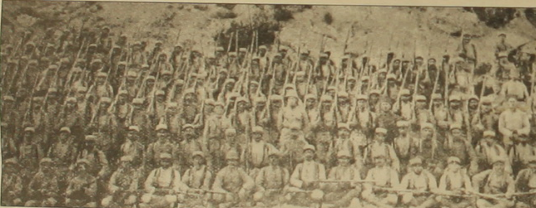
Հայ կամավորները Արարայի ծակասամարտի նախօրեին

րեի ջարդերը վերջնականապես ի դեմս են հանել իրենց «դեմոկրատական» հռչակած իշխանությունների նկատմամբ հայության փայփայած վերջին հույսերը՝ մղելով նրանց դեղի անձնաճոթ հորիզոններ: Թեւ ջարդերը տեղի էին ունեցել Կիլիկիայում, հայերը հետնառնում էին կայսրության հայաբնակ գրեթե բոլոր շրջաններից, քանի որ այդ վայրերում եւս նույնպիսի իրավիճակում հայսնվելու սարսափը չափազանց մեծ էր: