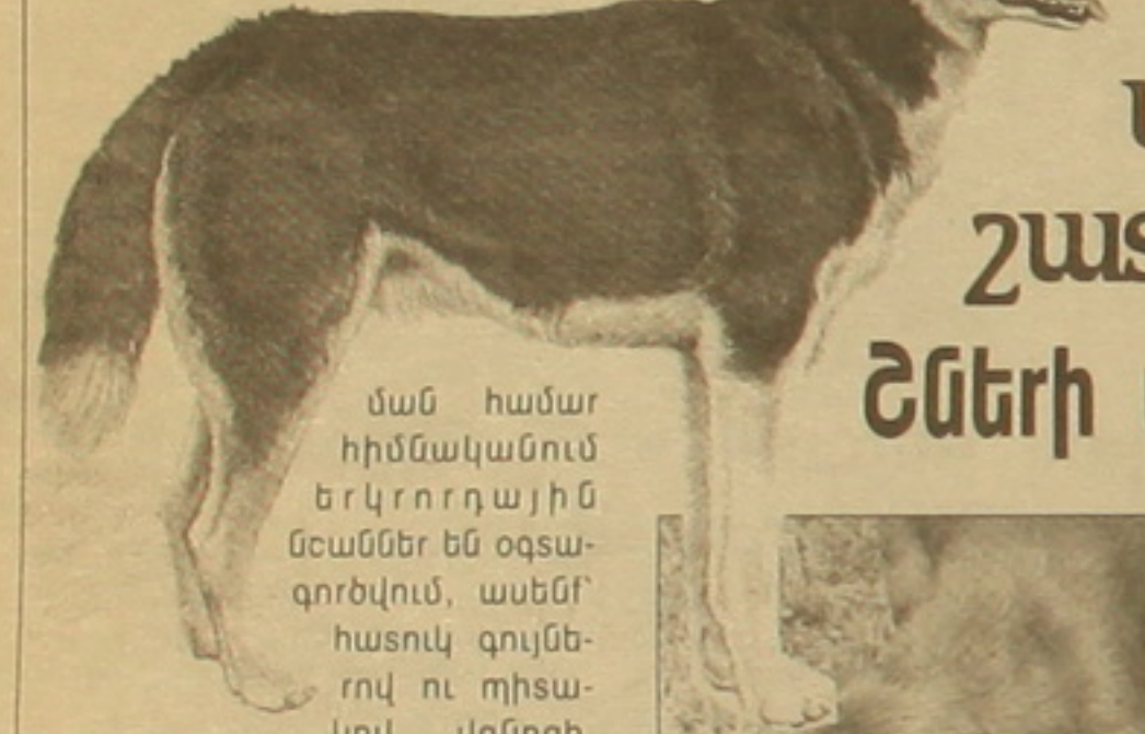
Ման համար հիմնականում երկրորդային մեաններ են օգտագործվում, ասենք՝ հասուկ գույներով ու լիսակով վզնոցի,

ստերիլիզացիայով չի կացել: Շնորհ ստանդորդ որդես ֆանսկը կրճատելու մեթոդ ես կիրառվում է, բայց ստերիլիզացիան էֆեկտիվ է գուճարներ աշխատելու առումով ու այնքան հնարարյան է, որքան ստանդորդ: Պեճ է հաշվի առնել, թե որ մեթոդն է իրադես հումանիտար, արդյոք ստերիլիզացիան, որի դեմքում կենդանին կսրվում է իր ոհմակից, իր սոցիալական սեղից, սանում է մեծ սրեսային վիճակ, մորից ընկնում է փողոց, որսեղ իր ոհմակը իրեն անմիջապես հես չի ընդունում, ոհմակի մախկին անդամների կողմից կարող է հարճակման ենթարկվել: