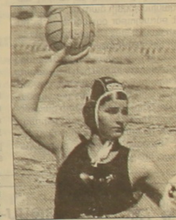
Քյանը (2005-ին), որտեղ իր թիմը 10-րդ տեղն է զբաղեցրել: 2006-ին Բեյլաբադում ջրագնդակի եվրոպայի առաջնությունում հոլանդացիները 5-րդ տեղն են զբաղել, իսկ 2007-ին Մելբուրնում՝ 7-րդ տեղը: Մալազայում կայացած կանանց եվրոպայի առաջնությունում (2008-ին) 5-րդ հորիզոնականը զբաղեցրելով, նրա թիմը Պեկինի ամառային օլիմպիական խաղերում է ստացել:

Ամսերգամի օլիմպիական մարզադաշտում տեղի է ունեցել հանդիսավոր միջոցառում՝ ժամանակակից Պեկինի օլիմպիական խաղերին մասնակցող հոլանդական մարզական ժամանակավոր շտաբի անդամներին: