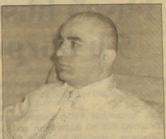
ՄԱԿ-ում ՀՀ դեսպան Արմեն Մարտիրոսյան

Այս ամսվա վերջերին ՀՀ նախագահ Սերժ Սարգսյանի Մ. Նահանգներ մեկնելու առաջնությամբ Բոստոնում հրատարակվող «Ամիսն միրոս սիեթեթեր» շաբաթաթերթի գլխավոր խմբագրի սեղակալ Դեֆնի Աբիլ օգոստոսի 26-ին ճեղագրույց է ունեցել ՄԱԿ-ում Հայաստանի դեսպան Արմեն Մարտիրոսյանի հետ: Վերջինս նշել է, որ ՀՀ նախագահը սեպտեմբերի 25-ին ելույթ է ունենալու ՄԱԿ-ի Գլխավոր ասամբլեայում: «Սա երկրորդ այցելությունն է, ուստի Մ. Նահանգների առաջնորդների հետ հանդիպումներ չեն նախատեսվում», ասել է նա, ավելացնելով, որ բացի ՄԱԿ-ում ելույթ ունենալուց, նախագահը այնտեղ հանդիպելու է այլ երկրների իր գործընկերների, ինչպես նաեւ Նյու Յորքի հայ համայնքի ներկայացուցիչների հետ: «Նա այստեղ է լինելու ընդամենը երկու օրով», նշել է նա: Պատասխանելով Ռուսաստան-Վրաստան հակամարտության հետաձգման վերաբերյալ հարցին, դեսպան Մարտիրոսյանն ասել է. «Իհարկե, այս հակամարտությունը իր հետեւում կունենա Հայաստանում: 90-ականներին, խՍՀՄ փլուզումից հետո ֆաղաֆական դաշտերում էր սեղի ունենում Վրաստանում, որը արտաքին աշխարհի հետ մեր կառուցած երկրն էր: Մեզ մեծապես հետաքրքիր է կայունությունը Վրաստանում: Լարվածությունը շարունակվում է եւ Ռուսաստանի նախագահ Մեդվեդեւը հենց նոր ծանաչել է Աբխազիայի եւ Հարա-»