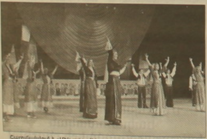
Ըարունակվում է «Մեկ ազգ, մեկ ձեռնարկ» համահայկական 3-րդ ձեռնարկային փառատոնը հանրաշնչության մարզերում եւ Արցախում: Արդեն 7 մարզերում եւ Արցախում կայացել է «Բարեկամություն» համերգային ծրագիրը, որին մասնակցել են նաեւ մարզերի գեղարվեստական խմբերը:

խում: Արդեն 7 մարզերում եւ Արցախում կայացել է «Բարեկամություն» համերգային ծրագիրը, որին մասնակցել են նաեւ մարզերի գեղարվեստական խմբերը: