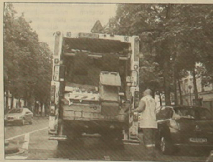
Ստավուոյան այսպես են հալալում փարիզյան փողոցների աղբը

Երկնից կրակ է թափվում: Սերգեյան ինստիտուի օուկայից մինչեւ տուն 200-300 մետր արառություն է. ծանր օոզը անվերցանալի է դարձնում ճանաղարիը: Արեից հայանված միզն ու քանցարեղենը խղճահարություն են հարուցում, վաճառատեղանից այն կողմ թուլացած, խեղճացած մարդիկ հազիվ են իրենց կանգնած դառնում, գեցնին փուլած ուրցը արունակում է զարնացնել իր աներեսությունը (տեսնես, գոող կա): Օուկացած Եսեցը արդամաններից հեռացել, մեկնվել են սպերոս տեղերում: Խողովակներից քայք քողած ջուրը զազոններ լցվելու փոխարեն ողողել է փողոցը, չլմփողով անցնում ես, ոսերդ՝ կեղտաքի մեջ: Հասնում ես ամենաղճվար հասվածին՝ Եսնի ամող արդունում: Թեղված ոսերից ակա հայտնվում է կիսակերած, հոտած ձմերուկով գեղճանե սոդրակը: Լողկալի տեսարան, հայացող չգիտես ու դարձնես, օուրջուրը նույնն է՝ աղբ, աղտեղություն: Անցնում ես, հասնում Եսնի մուսիին, աղբի ուղկների փակ դռներից դեմիդ է փչում մի անմեկարագելի սուր զարեալոս: 11 օր աղբը թթվել, մնացել է: Շաք առաջ սեղծում եմ վերելակի կոճակը՝ օունչա դաս: Վերելակը չի ախտաոս: Նորից: Ձեռնիս իրեք ուզում եմ օուրջել, քաղնանալ չեմ ուզում, տուն գնալ չեմ ուզում: Մի 200 մետր վրա Եսնիին երեսանցից այստեղ, այր՝ սերես կարող է ամենից հենց նման քաներից, էլ չեմ խոտում մյուս՝ սոցիալական ու հոգեբանական սերեսների մասին: