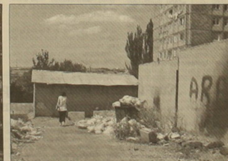
Աղբերով լեցուն քաղաք Երևան

խնդրանով է, որ իրեն մեծաղյա աղբաման են տեղադրել: Եթե նույնիսկ այդպես է, միթե վարձակալող կողմը արդահանության դասալորություն չի ստանձնում եւ միթե դասախանակության ենթարկող չկա: Քաղաքային արդահանությունը թաղալոբսաաոսների, փղախալոբսաաոսների իրավասությունների ակա չէ, ինչ է: Սերգեյան ինստիտուից մեզ դասախանեցին, որ արառեց իրենց չէ, ինչը հերկվեց թաղալոբսաաոսում: