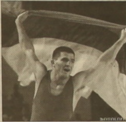
Օլիմպիական չեմպիոն Արմեն Նազարյան

48 կգ կշռային ըմբիշ Արմեն Սևրջյանը ազատ ոճայինների մրցակեցում եւս հասավ մինչեւ եզրափակիչ, որտեղ համառ դարձավ