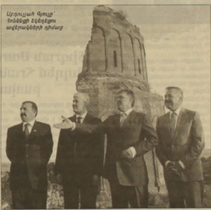
Արդուլյանի Գյուլը՝ Գյուլի հետ Կարսում ավերակների դիմաց

Երեկ Կարսում Թուրքիայի նախագահ Արդուլյանի Գյուլը դասնական արարողությանը ոչնչեց Կարս-Թրիպլիսի-Բաբու երկաթգծի շինարարության թուրքական հասկանի սկիզբը: Արարողությանը մասնակցեցին Կասասանի և Արցրեզանի նախագահները: 180 կիլոմետրանոց երկաթգծի թուրքական հասկանը 76, վրացականը՝ 29, իսկ արցրեզանականը՝ 80 կմ է: 450 մլն դոլար արժողությամբ այս նախագիծը ենթադրվում է ավարտել 2010-ին: Երկաթգիծը կունենա տարևան 1 մլն ուղեխոս և 6 մլն 500 հազար տոննա բեռ փոխադրելու տարողություն: Նախագահի իրականացման դեղին Բաբուից Երզրուզ գնացն անխափան կիսանի Կարս, որտեղից էլ Ասամբուլ: Այլ կերպ, այս նախագծով Բաբուն ու Թրիպլիսի կապվում են ոչ միայն Կարսի, այլև Ասամբուլի հետ, ինչն առանձնակի կարևորում է դրա նշանակությունը Կասասանի և Արցրեզանի համար: Վերջին օրերում 33 նախագահ Սեմ Սարգսյանի նախաձեռնու-