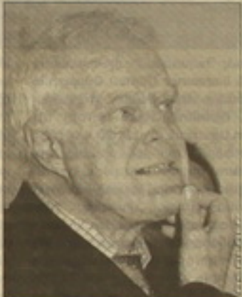
րոե հաղորդագրությունների եւ իրն վերագրող հայաքարությունների աուչությունը նա հասակեքեք, որ

«Եք վաղը լինել իմ գեկույցը մոնիթորինգի հանձնաժողուկին, ա-դա կՑերկայաքվել, որ ԵՆԻՄՎ քա-նաձեը լիարժեք չի իրականց-վել», երել Եվրոպայի խորհրդի մար-դու իրավունների հանձնակասա-րի Հայաստան հերքական այցի ավարքին կազմակերքված առուկի-սում հայաքարեք Թոմաս Դամար-քերգը : Երել օրում նա փորձել է գեհասել ԵՆԻՄՎ հասկարքե վեր-քին 1620 քանաձեի կասարման ընթացքը: