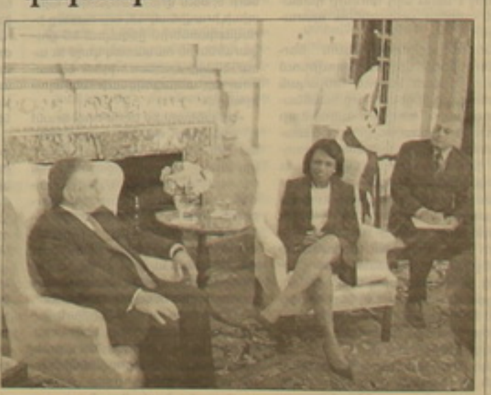
ԱՄՆ դեքադանասուը հաղորդագրություն է քարաձեել, որ ուքեքարուղար Կոնդուկա Ռայսը եւ արագործնախարար Եղվարդ Նալքանդյանը ստորագրել են «Հայաստանի Դանադեքության եւ Ամերկայի Միացյալ Նահանգների կառավարությունների միքե միջուկային ու ռադիոակալիկ նյութերի մախանենու փոխադրումների դեմ դալախի ոլուրում համաեղ գործողությունների թրազիր»:

ԱՄՆ դեքադանասուը հաղո-րագրություն է քարաձեել, որ ուքեքա-րուղար Կոնդուկա Ռայսը եւ ար-ագործնախարար Եղվարդ Նալքան-դյանը ստորագրել են «Հայաստանի Դանադեքության եւ Ամերկայի Միացյալ Նահանգների կառավա-րությունների միքե միջուկային ու ռադիոակալիկ նյութերի մախանենու փոխադրումների դեմ դալախի ո-լուրում համաեղ գործողություն-ների թրազիր»: Դեքադանասան հա-ղորդագրությունում նեվում է, որ այս համաձայնագրուկ ԳԳ-ի եւ ԱՄՆ-ի կառավարությունների նեանակա-լիորեն ամաղուղում են իրենց հա-մաեղ քաները, որում ուղղված են սահաքելիքների կողմից քարձր օա-դիոակալիկության նյութեր ձեռք բե-րելու վեանգի կանխմանը: Մինչ այս ԱՄՆ կառավարությունը նա-նասիղ համաձայնագրեր էր ստ-որագրել Ռուքախիայի, Դազախասա-նի, Վրաստանի ու Ռոքղզասանի հեծ: