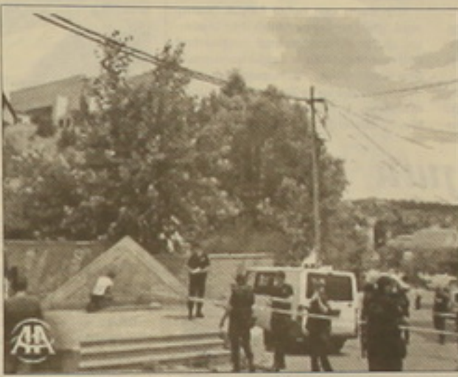
Սամբուլում զինված հարձակումը կատարվել է հուլիսի 9-ին:

Հուլիսի 9-ի առավոտյան Սամբուլում զինված հարձակում է կատարվել ԱՄՆ հյուպատոսարանի գլխավոր մուտքի մոտ տեղակայված ոստիկանական դահլիճի վրա: Հարձակումը իրականացրել են երեք ահաբեկիչներ, չորրորդ դիմացի մայրից ստանալ է մեքենայի մեջ: Թեև ահաբեկիչներն սպանել են դահլիճի ոստիկաններից երեքին, իսկ մեկին՝ վիրավորել, սակայն բախման ընթացքում սպանվել են նաև իրեն, չորրորդ այդ նույն մեքենայով տեսափոստի հեռացել է սպանության վայրից: