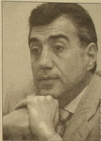
Սմբաս Լոյուսյանը, Կարեն Գրիգորյանի, Մանուկ Պետրոսյանի, Ռոբերտ Գրիգորյանի, Ջավահիր Անդրեասյանի, Գրիգոր Մելիքյանի, Արման Փաշինյանի, Ռոմմ մեծ աղագա ունեն:

Երկ «Տեսակետ» ակումբի հյուրն էր միջազգային գրոսմայսթեր, լուսավորչական օլիմպիադայի չեմպիոն, Chess լուսավորչական միության սեփական, լուսավորչական հաստատության Ֆեդերացիայի փոխնախագահ Սմբաս Լոյուսյանը : Մինչև ատլետիկ սկսելը, մեկնակերպ մեկ ուղի լուսավորչական հաստատության անձնակազմի հետագայում Կարեն Ասրյանի հիշատակով: