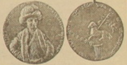
Մեղայ - Խոջա Գրիգորի պատկերով

տանի ծագման հիշատակները», գրում է Խաչիկյանը: 14-րդ դարի ընթացքում Մոսկվայում զարգացել ու դարձել էր դարձել է Արեւելյան եվրոպայի ամենախոշոր սենսական կենտրոններից մեկը: Առեւտրական կապերի հանգուցակեցը եղել է Ղրիմի նշանավոր ծովախնայա հաղաբ Մուրոզը, ապա Կապիյան: Մինչեւ 15-րդ, 70-ական թթ. այսինքն՝ մինչեւ Ղրիմի գրավումը թուրքերի կողմից, այդ հաղաբները, մասնավորապես Կապիյան, լինելով միջերկրածովյան հաղաբ երկրների հետ սենսական կապերի հանգուցակե, միջատի դեր են կատարել Ռուսաստանի համար: