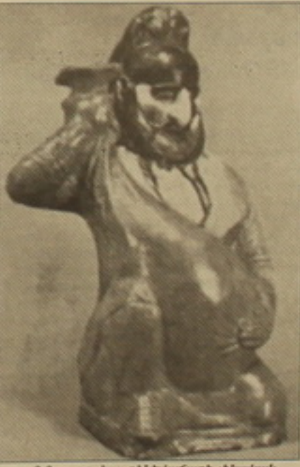
Ն.Յ. Պր. իր. հայ գիտնականի լինական արձանիկ