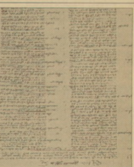
Մարիադի հաշիվներ, 1711-18 թթ. Մասեմադարան, մե. թիվ 6241

մեքադությունը, «ստորոցների մեծ մասը սկզբնական օրերում եղել են Պողոսի նման. Մոսկվայում առեւտրական աշխույժ գործունեություն են ծավալել, քայքայ եղել են ոչ թե մոսկաբնակ, այլ դիմացի «ստորոցային» հյուր»: Բազմաթիվ դիմահայեր էլ՝ սակավին 14-րդ դարի կեսերին, իսկ ավելի մեծ չափով՝ 15-ի ողջ ընթացքում, այնուհետ սերս սենսական կապեր են ստեղծել Մոսկվայի հետ, հաստատվել իրենց հայրենի տեղանքներում, սուս ու տեղ սեղծել, ձեռք բերել բարձրակարգ ու անօտար կալվածներ, ռուսների հետ հաստատել խնամիրական կապեր, որ «ստորոցի» կոչումը նրանց համար դարձել է արդեն ազգային դասակարգային կալվածի տեղի: «Պե՛տ չէ անեսել եւ այն հանգամանքը, որ «ստորոցներից» սերված Մոսկվայի հաղափաղ դարձած վաճառականներից շատերը, տեղի տալով ռուսական եկեղեցու ճնշումներին, խզում են իրենց կապերը մայր եկեղեցու եւ դատմում ուղղափառ: Այդպիսով նրանք ավելի էին մեղմում ռուսական միջավայրին, մոռացության տալով իրենց գերդաս-