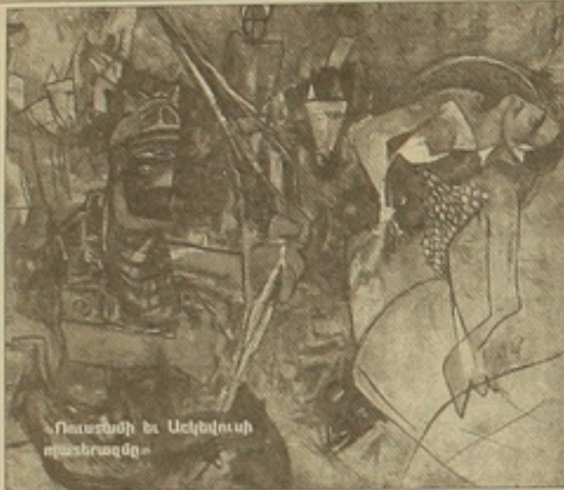
Պատանդի և Ավելուսի դասնազոցը

Ժամանակի ժաղկալենին մարդ թողնում է իր հետը՝ լավ, վատ, կամ ոչինչ, ըստ իր արտաբերության: Ի՞նչ է ավանդույթը մասնավորապես հեծնորդների, ինչպես է կասարվում ընտրությունը: Սեռանդների հիօնոլոգիան ի՞նչ արժեքներ է սնում իր դաստիարակումը: Ժամանակի ծախսում որևէ արժեքներ կոչում-մուտացվում են, չիմաստավորված մասնավոր անարժեքության «ժառանգություն»: Արժեքներ խելով ժողովուրդներն իրենց կենսագրությունը հարստացնում են անցյալի հիօնոլոգիայով, նաև ի գին իրենց արդյունավոր զավակներին փայլեցնելով: Ասում են՝ որևէ մարդ արդեն ծակասագիր: Ասեղծագրործող մարդ