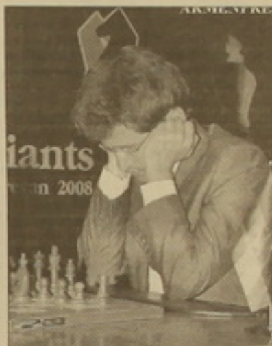
Մրցաշարի մասնակիցներին նվերներ ու դառնական մյարսուրյան (ըստ գրաված տեղերի՝ 70, 50, 40, 30, 25, 20, 15 եւ 12 հազարական դոլար) հանձնեց հանրապետության նախագահ, ժամանակի Հայաստանի ֆեդերացիայի նախագահ Սերժ Ասրյանը: Մրցաշարի փակման խոստով նա հետևյալը նշեց. «Վերջին մի ամիս օտերը մեզ միացրել էր ժամանակահատված մեծ իրադարձությունը ու ցավով օտեր, նաեւ կուրասի կակիցը: Այս մրցաշարը նախատեսել էինք անվանել «Գեյֆանդի մրցաշար», բայց ստացվեց այնպես, որ դեռ չսկսված, այն վերածվեց Կարեն Ասրյանի հուշամրցաշարի: Մեզանից շատերը Կարենին անմամբ էին ճաշակում, նրան գնահատում էին ոչ միայն որպես ժողովրդական ժամանակահատված, այլ նաեւ բարձր արտադրանքի տեր: Մենք անենք ինչ մեծ էր անցնի Կարենի հիշատակը, որը միայն հիշատակում էր Կարենին, որպեսզի ժամանակը ավելի մեծ մասնաշաղկապում ու զարգացում ստանա հանրապետությունում, որովհետեւ ժամանակը լավ մարզածի չէ, այն մարդուն դարձնում է ավելի իմաստուն, օգնում է գնահատել իրավիճակը, զգնել հաղթանակի հասնելու ավելի կարճ ճանապարհը: Ուստի ամեն ինչ անելու ենք, որպեսզի Հայաստանի բոլոր երեխաներին հասու դառնա այս իմաստուն խաղը: Որոշել ենք, որ այս մրցաշարը լինելու է ավանդական եւ մասնակցելու է Կարեն Ասրյանի անունը: Մեկ անգամ եւս շնորհակալորում ենք մրցաշարի մասնակիցներին: Շատ ուրախ ենք ու ոգեւորված, որ Լեւոն Արոնյանը կարողացավ ցուցադրել շատ վաղ իր հաղթանակի հասնելը: Կարենը թե այս բեմադրակն շատ հաջողակ է Լեւոնի համար: Եթե հնարավորություն լինի աշխարհի առաջնությունն այստեղ կազմակերպելու ու Լեւոնն էլ չեմպիոնի կոչումն ստանալու, ապա մրցաշարն այստեղ անցկացնելու նախատեսությունը համոզեալ կզամբ»: