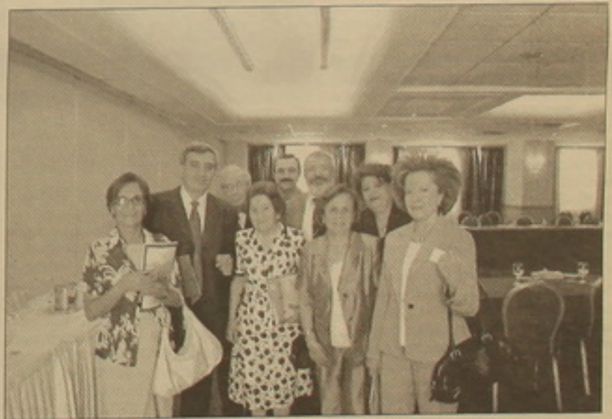
Նախկին մեկությաններից եւ ՀՀ զստությունների հետախոսի տնօրեն Ալուա Մեկության (ձախից երկրորդ):

Եթե ՀԲԸՄ դեկլարությունը գանկանում է վաճառել ազգային բարեարների սկիզբնությունը, բայց եւ քաղ կամ ունի, որ այն մնա կրթադաշտ, թող զինը ցարունակ չբանկարել, ընդհանրապես՝ նվազեցնել, իսկ եւ կզգնեմ գնորդ գտնել. զիսեմ մտակարանակ երեւ խոսողական իսկ ձեռնարկատերի, ո-