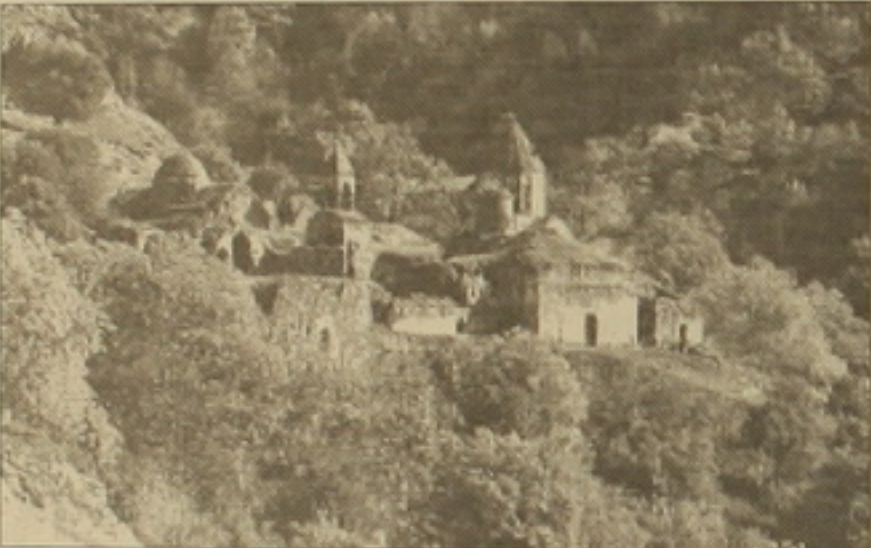
Գարիվանի մզկիթը գրմա

Զարսկ 5-ը ներկա Հայաստանի հարսեղ է: Ի վերջո գրողի հետևյալն է զարմացում: Խորհրդային իշխանության օրմ Արցախի ու Արցախի սարսափում գեներալ հազարավոր էրիտրոնական հուշարձաններ ու եկեղեցիներ հաճախ ոչնչացվում, իսկ լավագույն դեպքում ա-