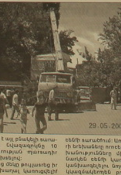
Բնակիչները մեկ թուլալեթ իր երեխաներին խաղալ կառուցվելի

մեմ արդում ենեւր Գայասանի Գանադեությունում, որտեղ մարդու իրավունքները համաթե են ուսահարվում, նրանց ժայհարն ամենայն հավանականությամբ անօգուս կլինի: Ուսիկանները վիճում են բնակիչների հետ, սպառնալով, որ անկարգությունների դեղում կմերթալայեն նրանց, եւ ոմդում են, որ իրենք՝ ընդամենը հրամանակասարներ են», անեմար չէին ցանկանա դեմ դուրս գալ ժողովուրդին, ոչ էլ իրենց բալեթում ենեւրը մնանաթող իրավունքով: Ուսիկանները 17-ամյա բնակիչներից մեկի մեմից վերցրեցին մի փաստաթուրք, որը բնակիչների բողոքի ժայտասխան է, ստացված հաղադալեթասանին 20.05.2008 թ.: Այնտեղ նեված է, որ մինչեւ հողադասարանի կից ակոնանակներ չհանդեվեն, կառուցադասողը, որը ասածը գնել է (անեւար գույի սեվիականության իրավունքի գրանցման վալալան 26.10.2007 թ., հ2241633), իրավունք չունի կառուցադասում իրականացնելու: Բայց նույնիսկ այդ ժայտասխան փաստաթուրքում չկար նեված, որ են-