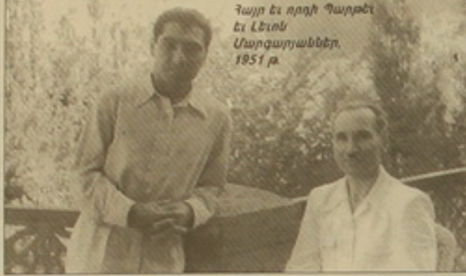
Տայր եւ որդի Պարթեւ եւ Լեւոն Մարգարյաններ, 1951 թ.

Երեւանի մոր եւ մանկան մանկաբարձության եւ զինվորական կենտրոնը հիմնվել է հետազոտության արհեստի: Կենտրոնի ստեղծման ժամանակահատվածում անմիջապես անցվել է Պարթեւ Մարգարյանի անվանը: Չայ գիտական մանկաբարձության հիմնադիրներից Պարթեւ Մարգարյանը իր տեսական աշխատություններով, ուսումնասիրություններով եւ լուսավորչական գործունեությամբ մեծ ազդեցություն է ունեցրել բժշկագիտության այս ոլորտի զարգացման մեջ: Նա հեղինակությամբ են առաջին անգամ հրատարակել մանկաբարձության եւ զինվորական կենտրոնի երկու ուսումնական ձեռնարկները («Մանկաբարձություն», «Գինեկոլոգիայի դասագիր»), որ մինչեւ վերջերս կրթության մեջ էին: Նա բժշկական ինստիտուտի սանիտարահիգիենիկ եւ բուժական ֆակուլտետի դեկան է եղել ընդ 10 տարի, 1943-45 թվականներին՝ առողջապահության փոխնախարար է: 1949-1973 թթ. Պարթեւ Մարգարյանը ղեկավարել է մանկաբարձության եւ զինվորական ինստիտուտը, ստեղծել դպրոց, ունեցել բազում հետազոտող, իր ղեկավարությամբ դասախոսել է 29 թեմատիկայով եւ 4 դոկտորական թեզ: