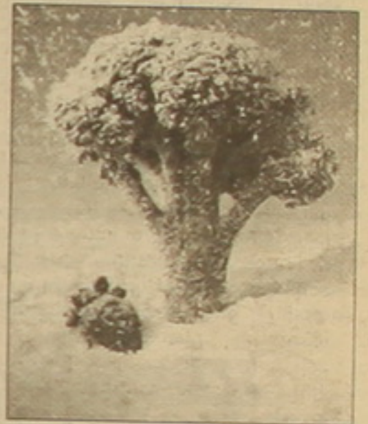
գնահատման համաձայն, վնասը կազմում է մոտ 1 մլրդ դոլար: Գյուղատնտեսության մեջ հնարավոր է հազարավոր աշխատատեղերի կորուստ:

Մալիբուի (Կալիֆոռնիա) ծովափին չորեքաթի օրը սկսված սառնաշոտալի փոթորիկը կարկիթ բանձր շոտով ծածկեց ամբողջ հարավը եւ ձնաբքով առաջացրեց: Օդերտնութաբանների կանխատեսումներին հակառակ, ուժեղ փոթորիկը հորդառաս անձրեւի փոխարեն ձյունատեղումների մասնառ դարձավ: Լուս Անջելեսի ճանապարհները սահադաւեթ են հիւլեցնում: Մանսա Մոնիկայի լեռներով անցնող ավտոճանադարը, փաստորեն, անանցանելի է դարձել: