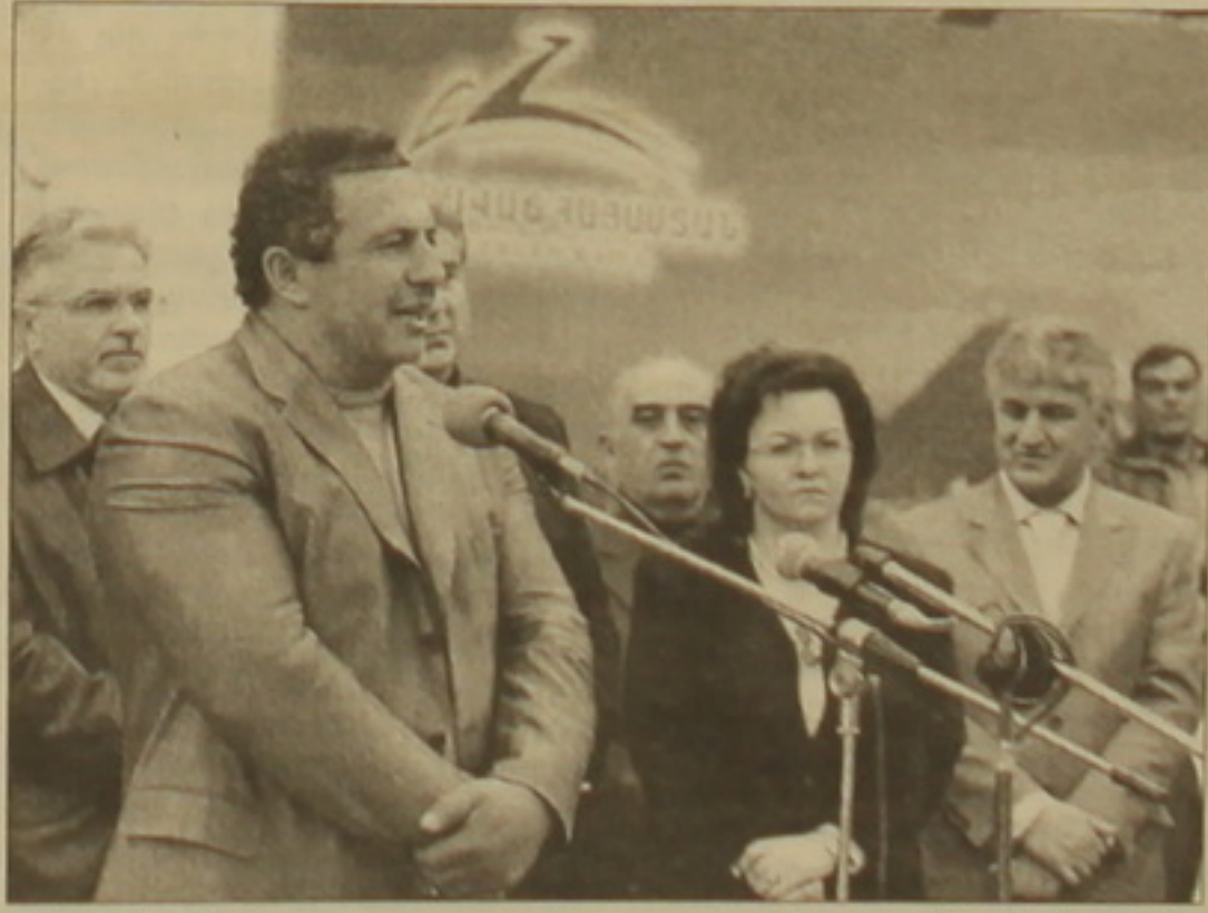
ունեցավ ԲՀԿ-ի խորհրդի անդամների ու կուսակցության ղեկավար Գագիկ Ծառուկյանի հետ հանդիպումը: Տես էջ 4

ՄԱՐԵՏԱ ՄԱՐԵՏՆԱ Ազգային ժողովի ղեկավարության քիվերի քիվերի փոփոխումը մնացել է ընդամենը 8 օր եւ գնալով ընտրողների հետաքննարկումն ավելի լայն թափ է ստանում: «Բարգավաճ Հայաստան» կուսակցության հանդիպումները հանրառարարական մարզերում ընտրողների հետ շարունակվում են երկուստեք խանդավառությամբ: Երեկ «Բարգավաճ Հայաստան» (ԲՀԿ) կուսակցության ֆակտական խորհրդի ներկայացուցիչները կուսակցության անդամների հետ, իրենց ղեկավար Գագիկ Ծառուկյանի գլխավորությամբ եղան Վայոց ձորի մարզի Եղեգնաձոր մարզկենտրոնում, որտեղ նրանց ջերմ ծափողջույններով դիմավորեցին մարզի 34 գյուղերի, 3 ֆակտական քաղաքահազար ընտրողները: Եղեգնաձորի մեակուսային ղեկավար հարող ընդարձակ տարածքում էր, որտեղ տեղի