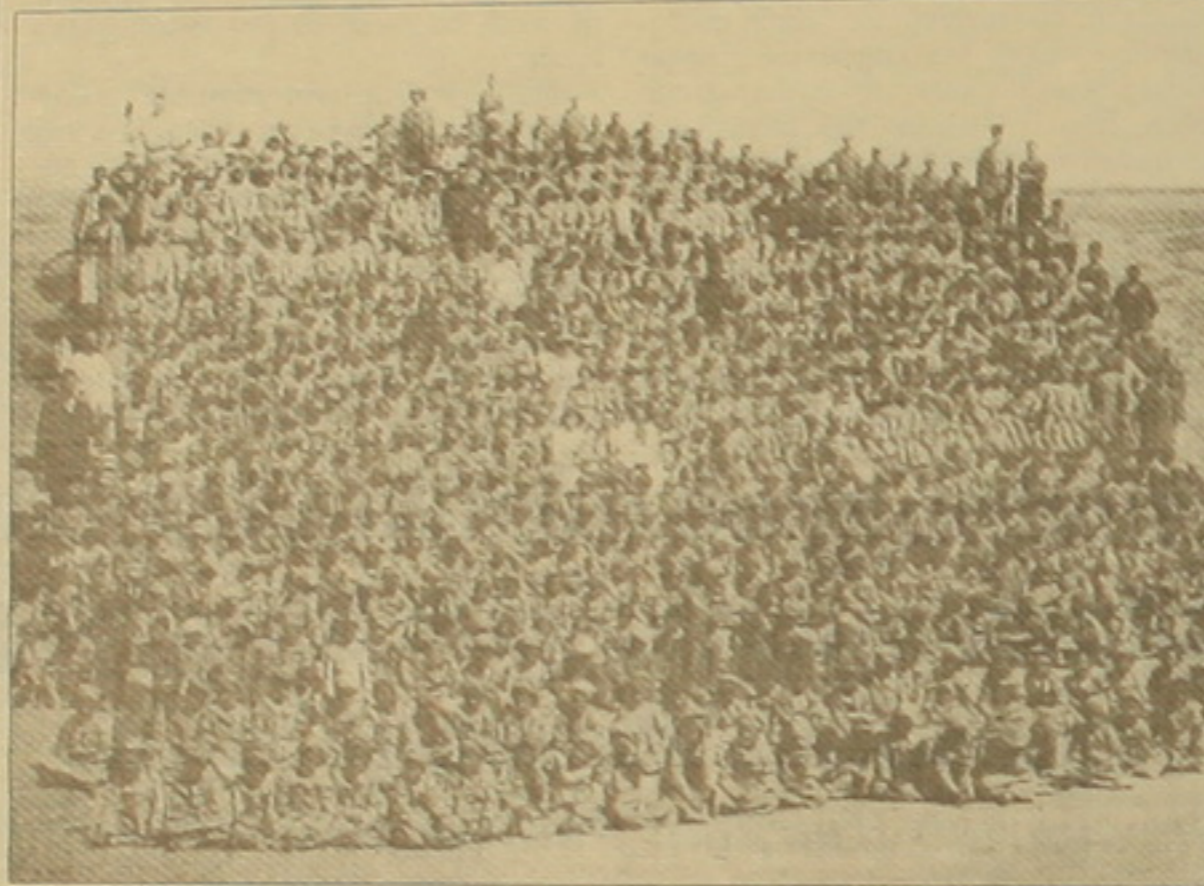
Բազումաշխարհի (այժմ՝ Իրաք) որբանոցի երեխաները

Գրեթե հարյուրամյա լուրջ ցեղային ճգնաժամ է աշխարհի խորքում: Հանուն մասնա- կան արդարության հիստորիաների մի քանի երկրների օրենսդիր մարմիններ, նաեւ եվրա- խորհուրդը առանձին նահանգներ, կազմա- կերտություններ ծանաչում են Հայոց ցեղաս- յունությունը, սարքեր բովանդակությամբ դասադասի խոսքեր ուղղելով մեղքը համա- ռոտն չընդունող թուրքիային: