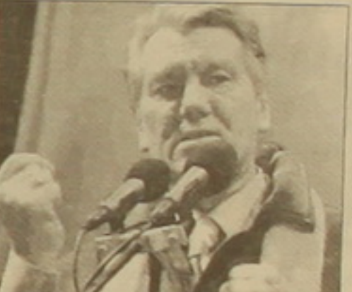
Ուկրաինայում ֆալսեթական դիմապատկերներ կրող խորհրդարանը, որը ընդդիմադիր խմբակցությունների մի ֆանի ղախականությունները միայն խորհրդարանական մեծամասնությանը, որը գլխավորում է վարչապետ Վիկտոր Յանուկովիչը:

Խորհրդարանի 450 անդամը 250-ը ղախական են այդ կոալիցիային: Անցյալ տարի կառավարությունը կազմավորվել էր միջին խմբակցության անդամների թիվը հասցնել 300-ի, որովհետև հնարավորություն ստանալով փոխելու երկրի սահմանադրությունը: