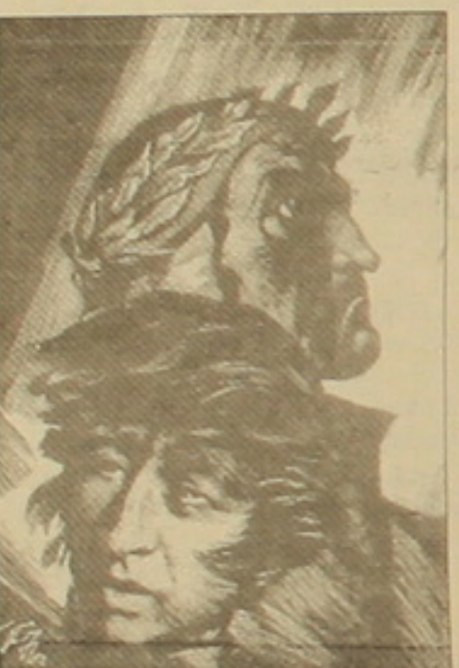
րոն՝ դասախոսություն չեն ունեցած իրարու հանդիպելու:

Սակայն կես ռոմե իսկ չանցած՝ Չարենցի հասակը փոք չէր այլևս... Անոր հասակը դարձավ կատարյալ անստեղծ խնդիր մը, եւ փոխանակ զգե՛ր մարդ ըլլալու, ան դարձավ գեղեցկագույններն մին: Անոր ձայնը ջերմ էր, եւ անոր աչքերը շիտակ էին, արթուն ու խելացի: