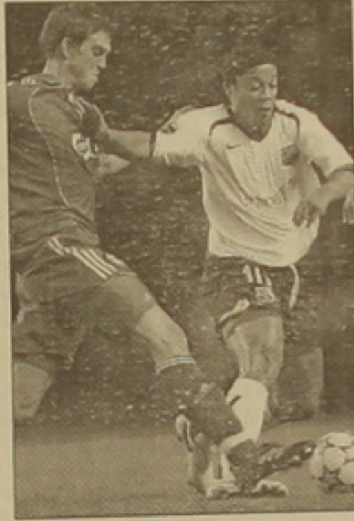
Մանչեսթերի խփած գոլերը հաղթանակ տարեցին «Ռոմային»:

Չեմպիոնների լիգայի գավաթակրի խաղում «Բարսելոն»-ը հաղթեց Եվրոպայի խաղերի ընդհանուր արդյունքով գերազանցել «Լիվերպոլ»-ին և արդեն 1/8 եզրափակիչում վայր դրեց լիազորությունները: Առաջին խաղում, սեփական հարկի սակ «Լիվերպոլ»-ից 1-2 հավելվ կրած դարձույթը բարսելոնցիներին դասախան մրցավեճում չափազանց դժվարին կացության մեջ էր դրել: Պայքար բարձրակարգի համար անհրաժեշտ էր մրցակցի դարձան անվազն 2 ամրաստիսան գոլ խփել: