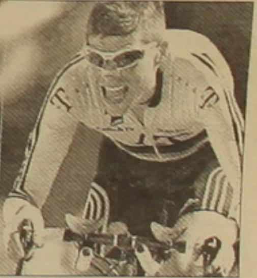
Սկանդալում մեղադրվողներից մեկն էր Եվրոպայի մրցաձևի հեծանվորդ Յան Ուլրիխը: Մակայն Ուլրիխին չդատեցին: Բայց այդ ընթացքում ամռանը նրան հեռացրին «T-Mobile» թիմից:

1997 թ. «Տուր դը Ֆրանս» հեծանվակազմի հաղթողը, գերմանացի հանրահայտ հեծանվորդ Յան Ուլրիխը, որ մեղադրվում էր դոպինգի օգտագործման մեջ, հայտարարել է մարզաձևից հեռացվելու իր որոշման մասին: 33-ամյա հեծանվորդը որոշել է խորհրդանշան մարզիչ աշխատել ավստրիական «Ֆոլկսբանկ» թիմում: «Ես ավարտում եմ ելույթներս մեծ սպորտում: Որոշում ընդունելն այնքան էլ հեշտ չէր, սակայն երբեմն անհրաժեշտ է լինել ներքին ծայրը: Առաջարկություններ ունեի մի քանի թիմերից, սակայն որոշեցի հեռանալ: Կայացրածս վճռի վրա իր ազդեցությունն է ունեցել իտալական սկանդալը, որի մասնատու էլ ինձ կարծես հանցագործ էի գտնում», հայտարարել է Յան Ուլրիխը: