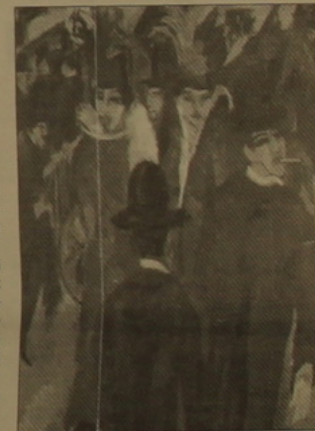
Էմիլ Լյուդվիգ Զիսիգ. «Բեռլինյան փողոցային տեսարան», 1913-14 թ.:

Կլիֆորտ Սիլի մուգ կարմիր արտահայտչական, իսկ Էնդի Ուորհոլի «Մառ» (1972 թ.) կտավը վաճառվեց 17.4 մլն: