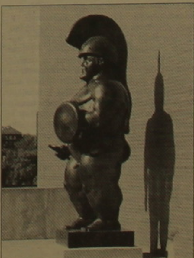
Բոթերո. «Ղոնապանի որդին», Երեւան

Այս գործերը դեռ համեմատվում են նաեւ Պիկասոյի հայտնի «Գեոմիկայի» հեռ: Ոճական առումով, իհարկե, Բոթերոյի ստեղծագործությունները ավելի հարազատ եզրեր ունեն Պիկասոյի նեոկլասիկական քաղցրի,