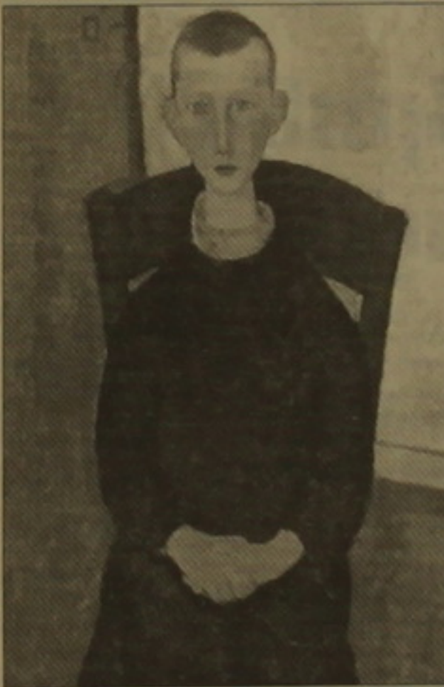
Սոդիլյանի. «Ղոնապանի որդին», 1918