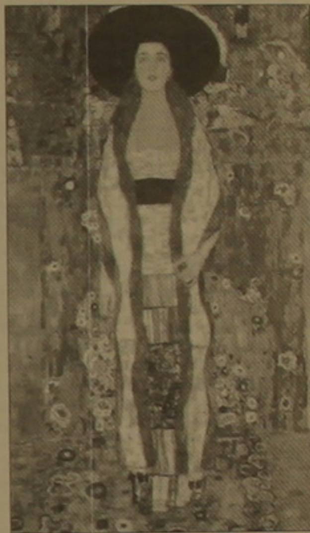
Գլխադրույթ Զիսիգ. «Ադել Բլոխ-Բաուերի դիմանկարը», 1912 թ.

Հաջորդ երեկոյի քիզնեսը եռում էր Զիսիգին, որտեղ հավաքվեց 239.7 մլն դոլար: Միայն 9 գործ՝ առաջարկված 81-ից, գնորդ չուներ: Անանուն հավաքածուները ող Զուսիգի մեծադիր «Անվերնագիր, XXV» կտավը գնեց 27 մլն.-ի: 7 մլն.-ի վաճառվեց