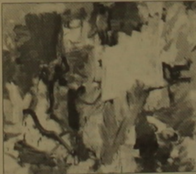
Վիլիելմ ող Զուսիգ. «Սնկերնագիր XXV» 1977 թ.

սեղեկացնում է ART in America հանդեսի 2007 հունվարի համարը, անախարեղ հաջողությամբ: Հիշյալ երեկ ընկերություններում էլ աճուրդի դրված գործերի մեծամասնությունը վաճառվել է, այն էլ նախատեսվածից բացառապես ավելի բարձր գներով: Երեսույթը եւս մեկ անգամ բեռնում է երկու բան՝ ավելացել են ներդրողներն արվեստի գործերի միջազգային շուկայում, եւ երկրորդ՝ արվեստի գործերի գինը բնավ չի նվազում, այլ՝ ընդհակառակը: Հենց իրենք՝ աճուրդի «Տերուն» խոստովանում են, որ համեմատաբար նախորդ՝ զարնանային եւ աճուրդային աճուրդներին, այս վերջինը ռեկորդային էր իրենց համար: Զիսիգին է այս անգամ եղել իրադրույթը շուկային՝ 866 միլիոն դոլարի ընդհանուր վաճառքի գումարով, այնինչ զարնանային աճուրդում այդ ընկերությունը վաճառել էր ընդամենը 438.8 միլիոն դոլարի գործեր, իսկ նախորդ աճուրդը՝ 409 միլիոնի: Սոթիգի աճուրդային վաճառքների գումարը կազմել է 476 մլն դոլար, իսկ զարնանային աճուրդը՝ համադասարանաբար՝ 433 եւ 313.6 մլն դոլար: Ամենահամեմատաբար արդյունքը արձանագրվել է Ֆիլիո, ող Փյուրի եւ ընկ.-ում, ընդամենը 41 մլն դոլար, որը սակայն կրկնակի է նույն ընկերության նախորդ աճուրդի գումարի: