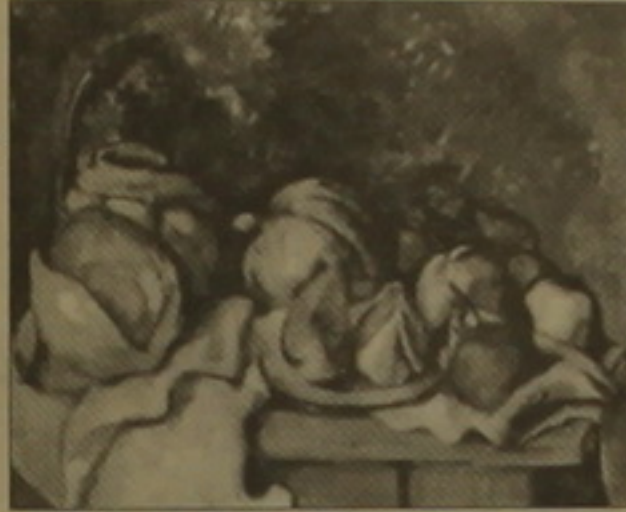
Սեզան. «Նախորդորտ մրգերով եւ կծուճով», 1845 թ.