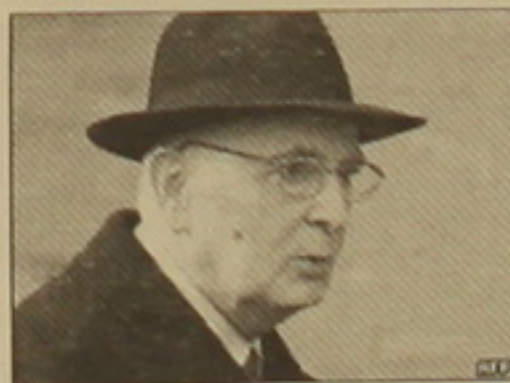
մասնակցությունը բարունակելու նրա առաջարկությունը:

Վարչադրեցի հրաժարականի դիմումը ռաջարանավորված է նրանով, որ երկրի սեռադ չորեքադրեցի օրը մերժեց Աֆղանստանում ՆԱՏՕ-ի գործողություններին իսալացիների