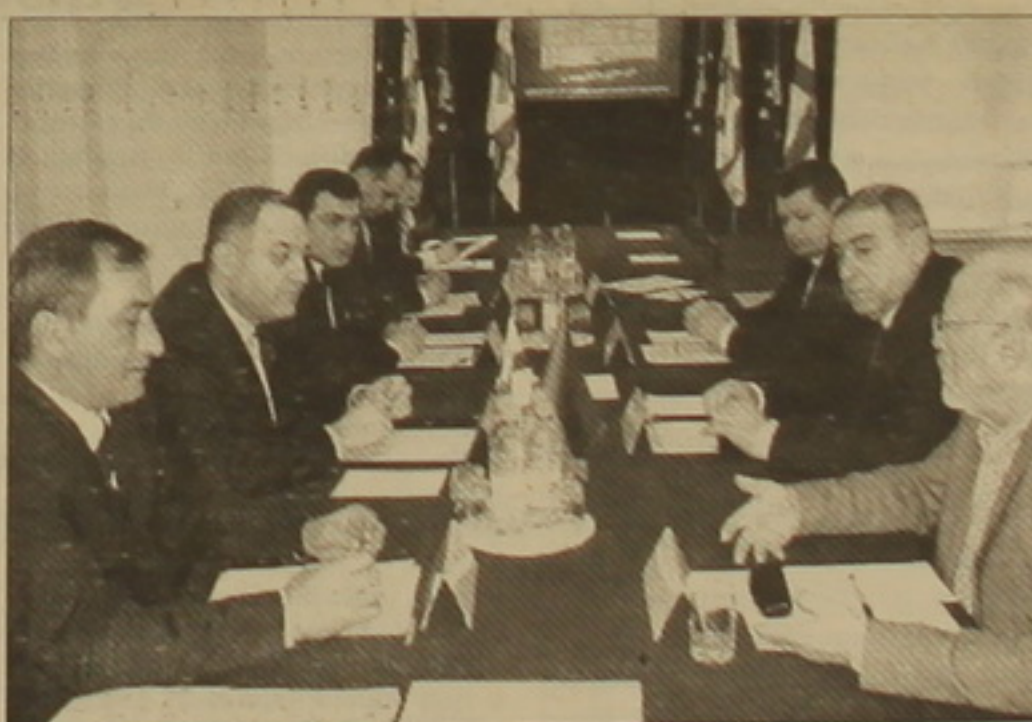
Վրաստանի արտգործնախարար Վադրան Օսկանյանը (աջ) և Հայաստանի արտգործնախարար Ֆրանկ-Վալտեր Շայնմայերը (ձախ) հանդիպում են Երևանում:

ԱՎԱՐԻՆ ԿՐԵՄԻՆՆԻՆՍԿԻ Թբիլիսի Հայաստանի եւ Վրաստանի ընդհանուր սահմանի սահմանագրման եւ սահմանագրման հայկական եւ վրացական հանձնաժողովների համաձայնագրման երեկվա հանդիպումը հերթական էր այս գործընթացի մասնաճակատում: Սահմանագրման եւ սահմանագրման հանձնաժողովի համաձայնագրի, 33 փոխարտգործնախարար Գերման Ղաթիբջանյանը «Ազգ» հետ զրույցում նշեց, որ դրական է գնահատում սահմանագրման եւ սահմանագրման հանձնաժողովների համաձայնագրի հերթական հանդիպումը, որ սեղի ունեցավ փորձագետների մասնակցությամբ: «Մենք լուրջ աշխատում ենք սահմանագրման եւ կարծես թե այս փուլն էլ հաջողությամբ երեկ կավարտենք: Հավանաբար հունիսին