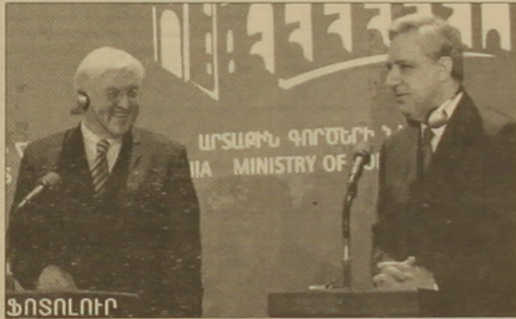
Ֆրանկ-Վալտեր Շայնմայերը (ձախ) և Վադրան Օսկանյանը (աջ) հանդիպում են Երևանում:

Ն. ԾԱՐԵՅՈՒՄ Ադրբեջան եւ Վրաստան այցելելուց հետո երեկ երեւանում 33 արտգործնախարար Վադրան Օսկանյանի հետ է հանդիպել Գերմանիայի արտգործնախարար Ֆրանկ-Վալտեր Շայնմայերը: Հանդիպման ավարտին հրավիրված մամուլի համասեղ ասուլիսում 33 արտգործնախարարը հիշեցրեց, որ որն Շայնմայերը մինչ այդ եղել է Բալկան եւ Թբիլիսիում, ապա եւ ավելացրեց. «Սա կարևոր այց է մեզ համար ոչ միայն երկրորդ, այլև եվրոմիություն-Հայաստան հարաբերությունների առումով, որովհետև Գերմանիան ԵՄ նախագահող երկիրն է»: Վադրան Օսկանյանը նշեց, որ Գերմանիայի արտգործնախարարի հետ հանդիպմանը մնալու է երկրորդ հարաբերություններին, սարածա-