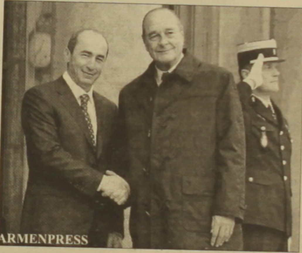
Երեկ Ֆրանսիայի մայրաքաղաքում հանդիպել են ժակ Շիրակն ու Ռոբերտ Զոչարյանը: Նրանք մասնակցել են Լուվրում «Ասոր Հայաստան» ցուցահանդեսի բացմանը: Լուվրի գոյության ողջ ընթացքում սա ամենամեծ ցուցահանդեսն է՝ ամբողջովին նվիրված հայ-ֆրանսիական արվեստին: Ցուցահանդեսը տևելու է 25 օր, ժամանակի ընդգրկումը Հայաստանում Բրիտանիայի մերթափանցման ժամանակից մինչև 19-րդ դարն է:

Կարծիքները տարբեր են, բայց ես կարծում եմ, նախնական ցնցալիքներն անցնելուց հետո այդ ստանությունն ազդեցություն չի ունենա: Հիմնականում ցաս ավելի խորն է և սկիզբ է առնում թուրք ժողովրդի դաշնակցության: Կայսրությունները միշտ էլ դժվարանում են ներողություն խնդրել, և սա էլ ավելի ճիշտ է, երբ խոսքն արեւելյան կայսրության մասին է: ՏԻ ԵՂ 2