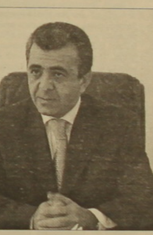
Manuk Vardanyan, Chairman of the Public Commission for the Fight Against Corruption

Կոզեռնի բնակիչները տարբեր դասակարգումներով չեն ունեցել իրականացնող փաստաթղթեր: Երևանի փողոցային 28.09.06թ. թիվ 1550-Ա որոշմամբ, 110 շենքի նկատմամբ վերականգնվել են իրավունքները: Այնուհետեւ, ՀՀ օրենսդրության հետ որոշակի անհամապատասխանության դասակարգում, 15.12.06թ. թիվ 2681-Ա որոշմամբ 110-ը դարձավ 97: Այդ 97-ից 10-ի մասով առկա են օրենսդրական խնդիրներ: Դրանք ինքնակամ կառույցներ են, որոնց խնդիրը մեքենայով կարգավորվի ոչ թե իրավունքների վերականգնմամբ, այլ ՀՀ կառավարության 18.05.06թ. «Ինքնակամ կառույցների օրհնականացման եւ սնորհման կարգը հաստատելու մասին» ՀՀ կառավարության թիվ 912-Ն որոշմամբ: Կադաստրի ղեկավար կոմիտեի սարածային ստորաբաժանում դիմելու փոխարեն, Կոզեռնի բնակիչները անհասկանալի դասակարգումներով հարցը փորձեցին կարգավորել տարբեր առիթներով դժգոհություններ արտահայտելով: Մինչդեռ մեքենայով համայնությունից 71-ը ստացել են վկայականներն առանց ժամկետների խախտման, աշխատանքային երկու