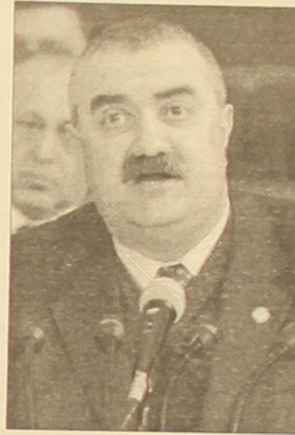
ղեժե նոր մակարդակի: Մեր ընկերները, մեր համակիրները ղեժ է ներին համոզումն ունենան, որ կուսակցության ծրագրի իրականացումը ի վիճակի է առավելագույնս վեր հանելու մեր հասարակության սեղծագործներում:

Հինգերորդ, «Բարգավաճ Հայաստան» հեղափոքական կուսակցություն չէ: Մենք հեռու ենք ցնցումների եւ բախումների ղաժարալի ինչ-ինչ գաղափարներ առաջ մղելուց: Մենք ժեժ ենք նորանկալիս Հայաստանի ամբողջ ղաժարությանը, ղեժ նկառնումներին, ղեժ ցալակի սղալներին: Հայաստանի բարգավաճման հեռանկարը մենք ուղղակիորեն կաղում ենք ազգային համաղալնության եւ հասարակական համեքաքության հեժ: Միայն այս ղալանմերում է հնարավոր այնպիսի ղոչի, որը ինքն, ուղ ալելի ընդհանրական ասած՝ սաղը սարիների ընթացքում երկիրը դուրս կբերի սնժետական, հասարակական ու աքաբարհալալալալալ ուղակա-