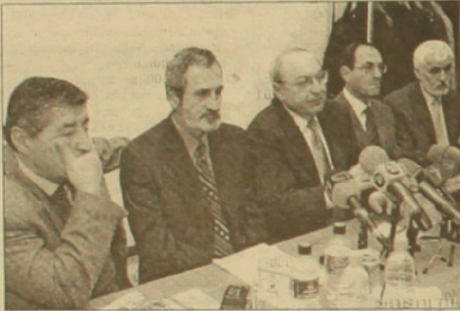
Վազգեն Մանուկյանը (կենտրոնում) և նրա ընտանիքը ընտրությունների արդյունքների մասին քննարկում:

Միավորվել ու միմյանց վստահում են Հոսան հաշարյանը, Շավարս Զոչադյանը, Արակ Սարգսյանը ու Մամվել Շահինյանը: Նույն անձինք, բացի միավորվելուց, նաև որոշել են ՀՀ նախագահական ընտրություններում սասարել Վազգեն Մանուկյանին: Որոշումը բացատրում են համատեղ ղեկավարելու և դրա ընթացում ձեռնարկված միասնական մտեցումներով: Դրան էլ, ինչպես փաստեց Վազգեն Մանուկյանը, ազգային ժողովրդավարական ղեկավարության կառուցման շուրջ են և այդ ուղղությամբ ընթանալու վճարվածություն ու համադասարան լուսարժեքները: Վստահ են նաև իրենց ու ժողովրդի ձգտումների և ներքին մղման նույնությանը, հետաքրքիր են որոշակի արդյունքին: Մասնից զատ նախագահի իշխանական թեկնածուից բացի, Վազգեն Մանուկյանի թեղեկացումներ, մյուս թեկնածուների հետ որևէ հակասություն չունեն ազատ, արդար ընտրության կառավարչությանը: ԱԺՄ նախագահ, ՀՀ նախագահի թեկնածու Վազգեն Մանուկյանի կարծիքով մեր երկրում ընտրությունները հայաստանյան միջին մակարդակից այն կողմ չեն անցել, սակայն նաև վստահ է, որ ժողովրդի ակտիվության ու որևէ ուժի հանդեմ վստահության դեմքում ընտրությունների լուսարժեքը այլ կլինի: «Եթե ժողովուրդը հիասթափված է գնում ընտրության, ապա ընտրվելովից հետո ստատուս կառավարիչ, ու դեմ անցնել էլ չես կարող: Այդ տեսակետից չեմ ստատուս ազատ, ապա ընտրություններ: Հայաստանում նման ընտրություններ ոչ մի անգամ չեն եղել, սակայն համոզված եմ, որ եթե ժողովուրդը համայնքված լինի լուրջ գաղափարների շուրջ, ինչն անեն մեկն իր ներսում կրում է, ապա դժվար թե այդ մեթոդներն ունենան նախկին արդյունքները»: