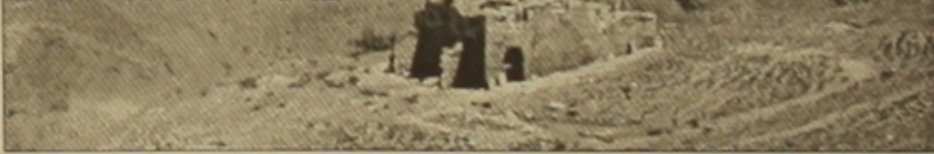
Օծոփի Սուրբ Աստվածածին վանքը

Հայազե-Նախիջեանագե Արամ Այվազյանը՝ մի կամավոր նվիրյալ, իր կյանքի իմաստը Նախիջեանի կորսվող հայկական արժեքների՝ հուշարձանների, վիմագրության, որմնակալության, քանդակագործության, խաչաքարի, հոգեւոր ու աշխարհիկ ճարտարապետության ուսումնասիրումն ու դրանք առաջադիմ ժառանգելու առաքելությունն է համարում: 200-ից ավելի աշխատություններ՝ 21-ը առանձին գրեթե մի մասը անգլերեն եւ ռուսերեն հրահանգչություններ, մասնակցություն բազմաթիվ միջազգային գիտաժողովների: Նախիջեանյան հայ մեակույթի ադրբեջանցիների կողմից ոչնչացմանը զուգահեռ ինձն անխոնջ մեակի աշխատանք է տանում այդ ամենը փաստագրել-վավերագրելու: Հավաքված հսկայական նյութն առավել ծախեկանորեն օգտագործելու եւ տարածելու համար Ա. Այվազյանը դիմել է նաեւ ֆիլմաւարին: 2003-ին Հայաստանի ամերիկյան համալսարանում կայացավ Նախիջեանի 5 գավառների մասին «Բանջված հայ աշխարհ» ֆիլմաւարի առաջին «Ջուղա. խզված մեղեդի» ֆիլմը, որ հասկանաբար ցուցադրվեց հայկական հեռուստատեսությամբ, ինչպես նաեւ ԱՄՆ-ում, Ռուսաստանում, Ֆրանսիայում, Իրանում, Շուսաստանում եւ եղան մամուլի արձագանքներ: Մեր գրույցը Արամ Այվազյանի հետ վերաբերում է մասնավորապես այդ ֆիլմին եւ դրա հետ առնչվող որոշ խնդիրներին: