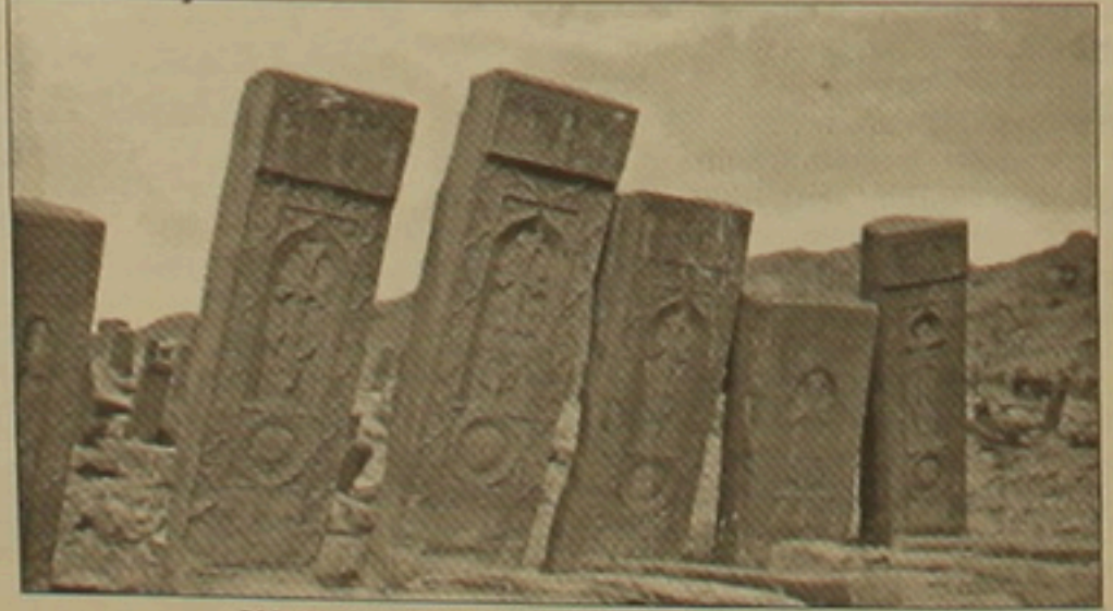
Գին Ջուղա. խաչքարերի խումբ, 16-17-րդ դդ.