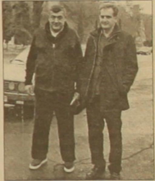
Լեւան Գալսեյիլաձե Վրաստանի առաջին նախագահ Գամսախուրդիայի որդու հետ՝ Աջարիայի ճանապարհին

Թբիլիսի Վրաց ընդդիմությունը դեռեսս նոյեմբերի 12-ին հայաստանց, որ հունվարի 5-ի արհեստը նախագահական ընտրություններին գնում է միասնական Լեւան Գալսեյիլաձեի թեկնածությանը, եւ նրա հաղթանակի դեղումը երկրի վարչադրե կինի Սալոմե Չուրաքիճուլիճը, որը վերջին մի քանի արդում է Վրաստանում, ծնվել ու մեծացել է Ֆրանսիայում: Բալթաստոն Սալոմե ընդդիմության հաղթանակի դեղումը կդառնա երկրի առաջին դեմքը, քանի որ նախագահության ինտեսուսը կհանվի՝ Վրաստանը դարձնելով խորհրդարանական երկիր: Ինչու ադեն սեղեկացրել էին, ներկայացնում են «Ազգի» հարցազույցները իրչալ անձնավորությունների հետ: