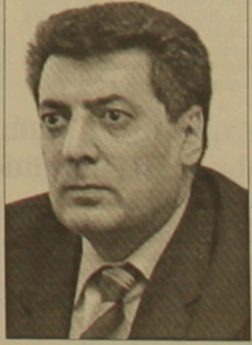
դակասի, Եուկայական հարաբերությունների այրուբերը չիմանալու դատարանով: Դրանք այդան Բանը

չէին լինի, եթե այդ հարաբերությունների հաստատումը սեղի ունենար դատարար եւ ոչ թե կայեանակյան արագությամբ: Ս. Դեմիրճյանը զնել է նաեւ խորհրդային Հայաստանի սեստության մի դատարն, որեղ գիտատար ճյուղերն էին սկսել ագխասել, փիմիական արդունաբերությունն իր սեղը զիջել էր սարաչիմոյանն ու էլեկտրոնիկային, կրթական համակարգը Եաս բարձր մակարդակի էր, իսկ այսօրվա կրթական համակարգը դարադատ խորհրդայինի խղճով մնացողն է: