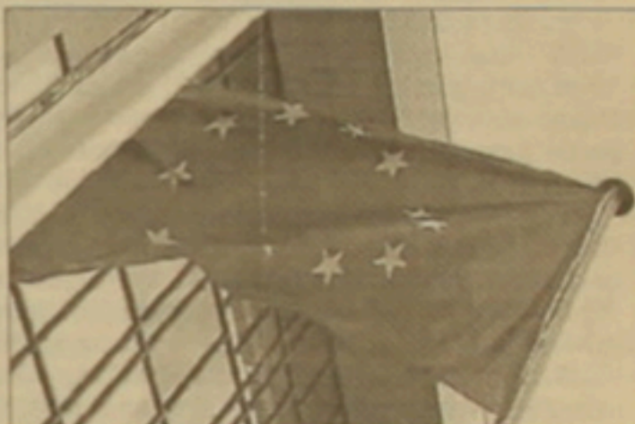
Եվրոպական իրավաբանական ասոցիացիայի անդամների կողմից հրատարակված ԵՄ ղեկավար կառույցի բարեփոխման նախագիծը:

Եվրոմիության 27 երկրների ղեկավարներն ու կառավարությունների ղեկավարները երեկ Լիսաբոնի զազաթոքոլում ընդունել են ԵՄ ընդ հիմնարար պայմանագիր, որը արդեն սաացել է Լիսաբոնի համաձայնագիր անվանումը: Ավելի վաղ՝ հունիսի 19-ին ԵՄ ղեկավարները հարթել էին վիճելի հարցերը եւ հավանություն տվել հիմնարար պայմանագրին: 250 էջանոց նոր փաստաթուղթը մարտահանում է ԵՄ ղեկավար կառույցի բարեփոխման նախագիծ, դառնալով ԵՄ սահմանադրության ղարգեցված արքերակը: Սահմանադրության նախադասությունն սկսվել էր 1990-ականների կեսերին, սակայն Եվրոպացիները սահմանադրության ընդունումից ստիպված հրաժարվել էին 2005-