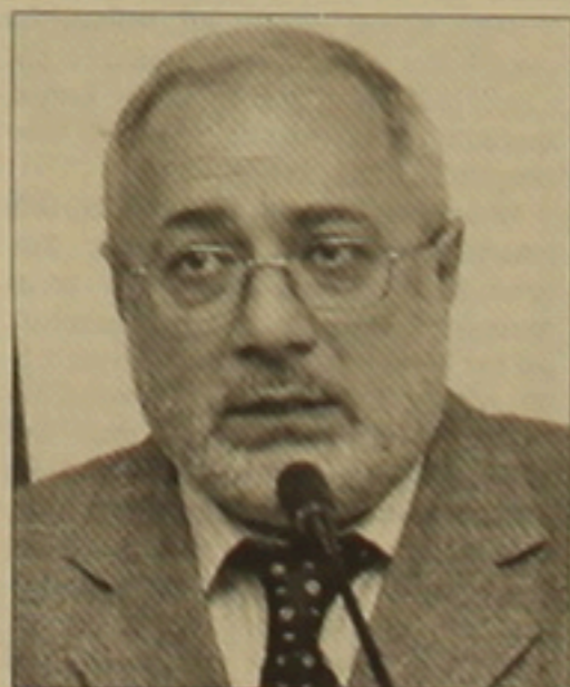
Իմաստությունը գովարանվում է ճանադարների վրա, բարձր ձայնով հռչակվում հրադարակներում...