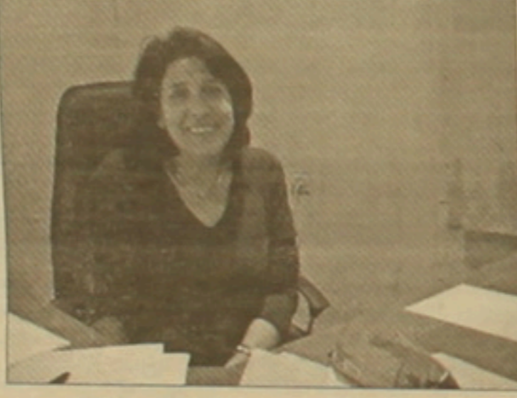
Վրասանի նախկին արզորնախարար Ալալունե Զուրաբիվիլին

Վրասան-Հայասան համագործակցությունը հավանական է Ներգրեչիկ ոլորում: «Վրասանի ողջ էներգեչիկ հարաբերությունները Ադրբեջանի ու թուրքիայի հե են: Տարածաբեանի հավասարակոություն համար ղեժ է էներգեչիկ կադե ունենաք նաե Հայասանի,