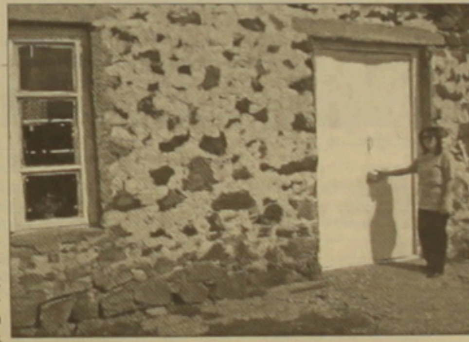
Գեղամաքակի համայնապետարանի դուռը միշտ փակ է, որովհետեւ համայնապետը մարզպետարանում է

Նկարագրված Գեղամաքակի տեղական ինքնակառավարման մարմնի գործունեության մասին միակ եւ վերջին տեղեկությունը կարող է լինել, եթե գյուղի բնակիչներն իրենց ղեկավարացումներով չլրացնեն այն: Առաջին գրուցակիցս՝ Գրեթա Ավագյանը, բազմամյա ընտանիքի մայր է: Ընտանիքում 7 անուն են: Ինքը համայնապետարան չի գնում. ճանն ընդունված է, որ նման գործերով զբաղվի ամուսինը: Չի կարողանում հիշել, թե վերջին 2 ամսում ինչ աշխատանքներ է կատարել համայնապետարանը: Միայն կարող է ասել, որ 7 ամիս առաջ իր եւ 3 այլ ընտանիքների մեղվափեթակներ են սվել: Համայնապետարանի աշխատողներից միայն հավաքարարին է ճանաչում: Ավագանու անդամներին Գրեթա Ավագյանը չի ճանաչում: Իսկ համայնի խնդիրներից նրան ամենից շատ մտաբերում է խնդիրը ջրի հարցը: Չեն կարողանում սնամեծ հողամասում գոնե կարճֆիլ ցանել, ֆանի որ ամռանը ջրի հարցն ավելի է սրվում: Գյուղում 1 աղբյուր ունեն, եւ երբ հարեան գյուղերի բնակիչներն արգելափակում են Գեղամաքակի ջուրը, իրեն հարկադրված էլի դաշկով՝ ու ձեռով Շասքեբ գյուղից են ջուր բերում: Իսկ Գեղամաքակը Շասքեբից շուրջ 1 կմ հեռավորությամբ է: