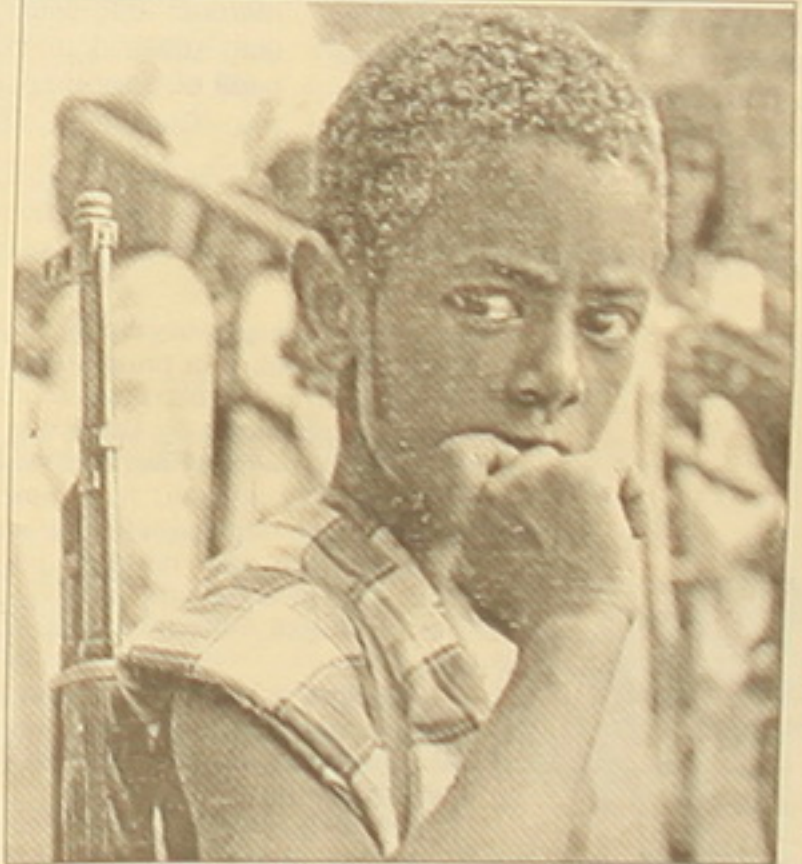
Վեն չափահաս մարտիկներից հեռու: Նշվում է, որ այդ դեռահասների արդյունավետ վերադարձումը ենթադրում է սեականություն: