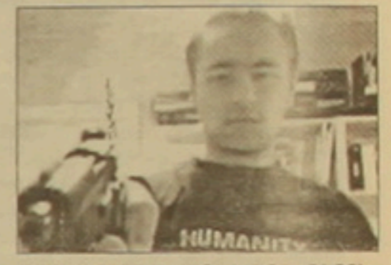
հրադարակել էր անգլերեն եւ ֆիններեն «մանիֆեստ» եւ սեփական լուսանկարները:

Ֆինլանդիայում երեկ սզո օր էր «Յոկելե» ոստանակա կենտրոնում կասարված սոյանդի դասճառով: Նախօրեին 18-ամյա առակերներին մեկը գնդակահարել էր 8 մարդու եւ առաջ ասրճանակն ուղղել էր իր վրա: Չոհերից մեկը դոյրոցի սնօրենն է: Ինքը՝ մարդասպանը, երեկ գիշեր մահացել է Յելսինկկի հիվանդանոցում: Յրճագոյրյան ժամանակ նաեւ վիրավորվել են 12 անճինք: