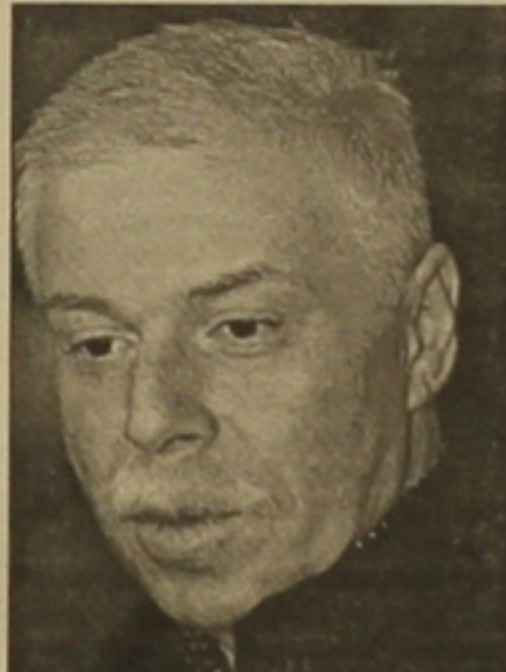
Բաղդի Պատարկացի՝ Վրաստանի վարչապետի փոխարինողը:

ԱՐԱՍԱՆԻ ՀԱՐՈՒԹՅՈՒՆՆԵՐ ԹՐԻԿԻԱԻ Նոյեմբերի 2-ին Վրաստանի մայրաքաղաքում տասնամյակի անոցի դուրս գալ ընդդիմության ներկայացուցիչները մեծագույն ցանկությամբ աղաղակելու նախադրյալներ ստեղծեցին: