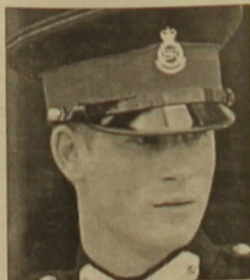
Բրիտանական թագուհու կրտսեր քույր իշխան Կարոլին, կասկածվում է որսազորության մեջ: «Գաղտնի» թերթը տեղեկացրել է, որ նախկին Կարոլինը Կարոլինին է նրա ընկերոջը հարցազրույցում և Նորֆոլկի կոմսությունը:

Իրենց վիճակն աստիճանայինացումից: Այսօր կառուցվում են մեծ կրթական ծրագրեր: Այստեղ ամեն ինչ դիտարկվում է Ռուսաստանի Եւրոմի շեղումներից: