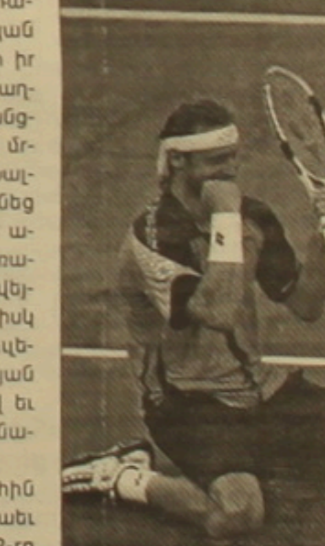
Վլեման Ամոնյին, չեխ Թոմաս Բերդիխին, արգենտինացի իուան Մարսին Դել Պոսոյին եւ սերբ Նովակ Յոկովիչին:

Արգենտինացի թենիսիստ Դավիթ Նալբանդյանը մարզական կարիերայում «Masters» կարգի իր առաջին մրցաբարը Եաիեց՝ հաջող ժամանակով Մարիդում անցկացված թենիսի միջազգային մրցումներում: Երափակիչում Նալբանդյանը տարության մասնեց թենիսիստների դասակարգման առաջասար Ռոզեր Ֆեդերերին: Առաջին խաղափուլում ավարտվեց Եվեյցարացու հաղթանակով (6-1), իսկ ահա հաջորդ երկու խաղափուլերում Նալբանդյանն առավելության հասավ միեւնույն 6-3 հաշվով եւ արժանացավ գլխավոր մրցանակին: