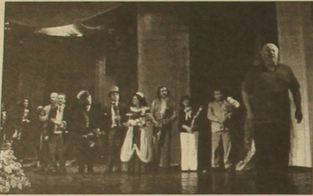
Դրանք ենք մենք Նյու Յորկում հայ բաժնետիր Էրեւանում: Երեք ան-մասնակի երկու փուլերից թե՛ Բեյքյանցիները Երևանի բաժնետիր հանդիսաստի:

Ավարակց թե՛ Բեյքյան ծակու-թային միության Նյու Յորկի Ջեյմսի «Մեր Արջյան» բաժնետիրի անդամիկ հյուրախաղերը Երևանում: Երեք ան-մասնակի երկու փուլերից թե՛ Բեյքյանցիները Երևանի բաժնետիր հանդիսաստի: «Ազգ» անդա-դարել է Ժ. Անանյանի «Տախի, տախի» թիմի թեմադրությանը եւ այժմ մեր ընթերցողներին ենք ներկայացնում մյուս երկուսը: Նախ սկսեմք Ռոբեր Թումանյանի «Օտարակ» թեմադրությունից: