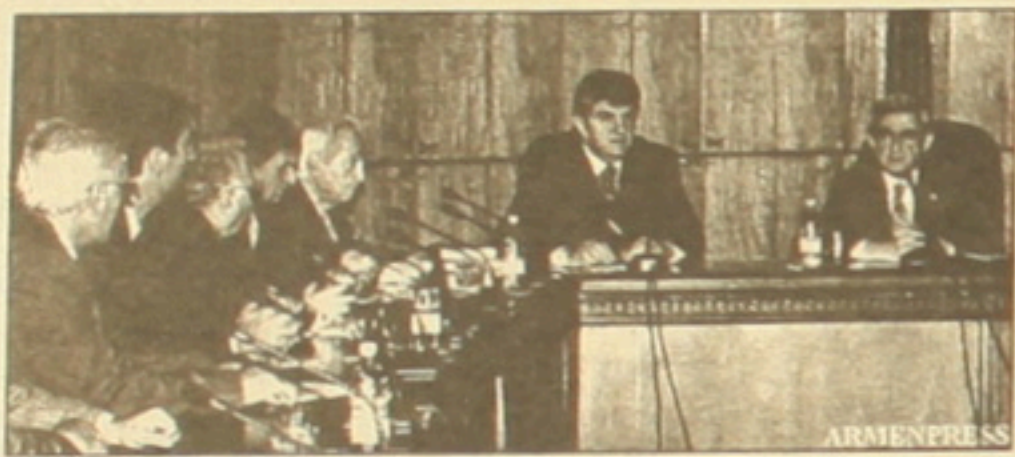
ՀՀ վարչապետ Սերժ Սարգսյանը ընդունել է Համաշխարհային հայկական կոնգրեսի և Ռուսաստանի հայերի միության նախագահ Արա Արսահանյանի գլխավորած պատվիրակությանը: Սարգսյանը խոսք է ասել հայերի միության նախագահ Արա Արսահանյանի և Ռուսաստանի հայերի միության նախագահ Արա Արսահանյանի գլխավորած պատվիրակությանը: ԱՊՐԱ ԱՐՍԱՀԱՆՅԱՆ

ՀՀ վարչապետ Սերժ Սարգսյանը երեկ ընդունել է Համաշխարհային հայկական կոնգրեսի եւ Ռուսաստանի հայերի միության նախագահ Արա Արսահանյանի գլխավորած պատվիրակությանը: Կառավարության մամուլի ծառայության հարցրդարության համաձայն, վարչապետը նշել է, որ Հայաստանում մշակույթի հետաքրքիրները են հետևում Ռուսաստանի հայերի միության եւ Համաշխարհային հայկական կոնգրեսի հայանդամներին: Ըստ նրա, ուժեղ մեծություն է ուժեղ սփյուռք ունենալու հայրենիքի եւ սփյուռքի ծրագրերը համահունչ են եւ այդ նպատակներին հասնելու ճանապարհին համագործակցությունն արդյունավետ է: