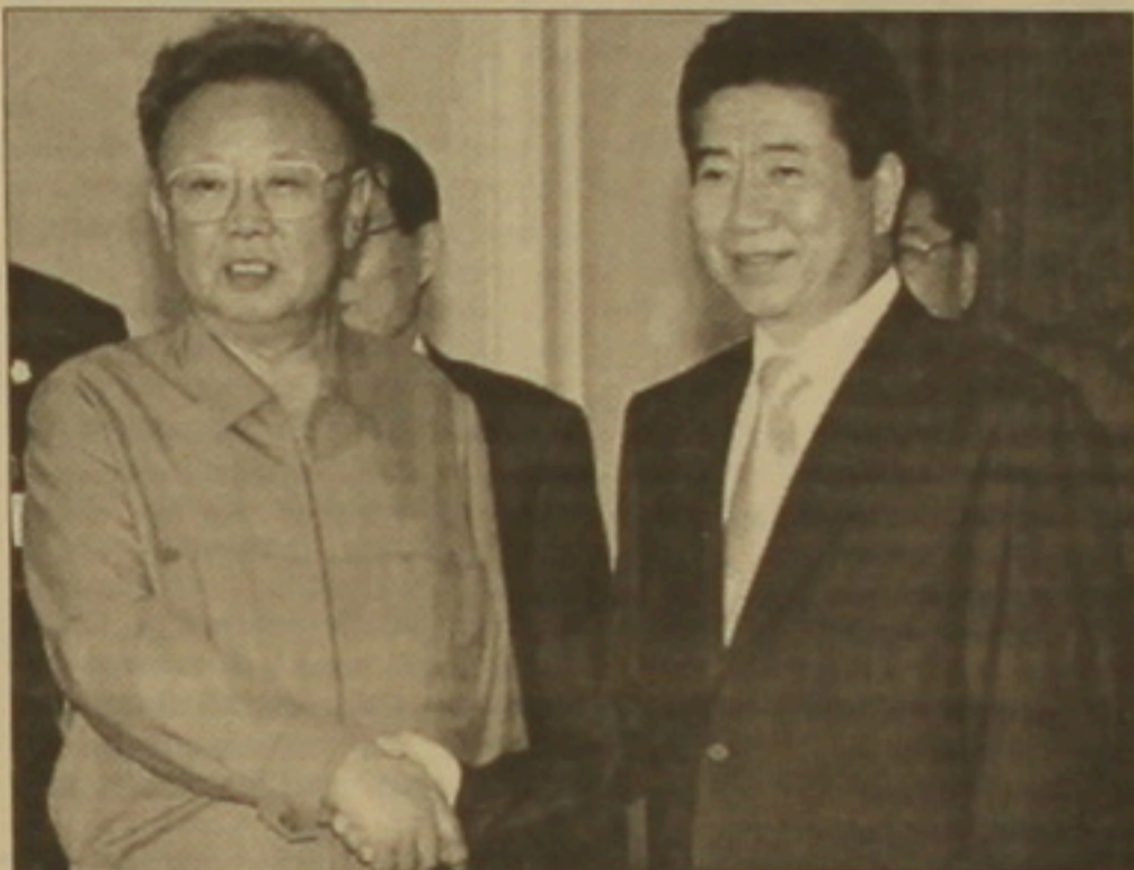
Կորեական կողմից հետո հարավկորեական ղեկավարությունը վերադարձել է Սեուլ:

«Ֆիզատ» թերթը հիշեցնում է, որ փետրվարի 13-ին ԶԺԳ-ի, Հարավային Կորեայի, ԱՄՆ-ի, Ճապոնիայի եւ Ռուսաստանի հետ ԿԺԴԴ-ի ստորագրած դաշմանագրի համաձայն,