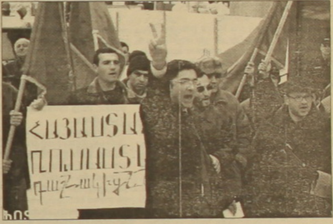
Վանքում կայացրած ակցիայի ժամանակ հայ երիտասարդները պահանջում են արդարադատություն հայ երիտասարդների դեմ:

ժամ աշխատում է: Իրավական ակտերի 455 խախտումների մեծ մասը վերաբերում է նման խախտումների: Նման դեմքում սովորաբար սահմանվում է նվազագույն աշխատավարձի հազարադասիկի չափով տուգանք: Այս ընթացքում շեշտությունը հասցրել է տուգանքներ անել հանրադատությունում հազարավան 120 հազար գործատուներից միայն 4816-ի մոտ: Չափազանց քիչ է տեսուչների քանակը, առավել ես մարդերում նրանք լիարժեք աշխատել չեն կարող, շեշտությունը ընդամենը 149 աշխատող ունի: