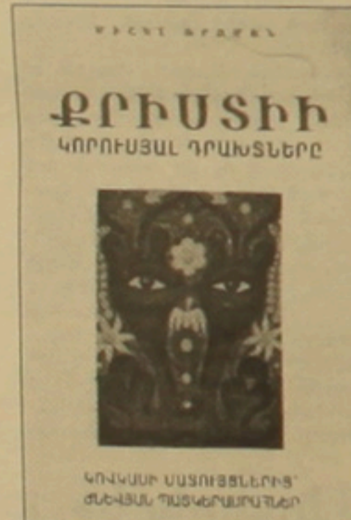
արադուր է, ով ժամանակին եղել է Ալ. Թադևոսյանի աշակերտը: 15 տա-րեկանում տեղահանվել է Հայաստա-նից և առաջին գտել Թավրիզում: Հետագայում մեկնել է Իրան, որ ձեռք է բերել ժամանակակից ժառանգորդի համբավ: 60-ամյակի շնորհիվ սկսում է զբաղվել մասնագիտությամբ և վաստակում Թադ մակառուցող Թե-հրանում և ժամանակ: Գիրք գրելու գա-

«Նա հենց նոր իմ առջև բացեց իր աշխարհի դուռը: Նրա կարողու-թյունը, որոնցում տեղավորվում է առաջին սարածությունների ողջ անսահմանությունը, խորամանկու-րեն նայում են ինձ»: Այսպես է սկս-վում ֆրանսիացի լրագրող, արձա-կագիր Միշել Ֆրանսի «Քրիստի կորուստը դրախտները» գիրքը, որի հերոսը Հայաստանում ըստ էության անհայն հայ ժառանգորդ է և նկա-րիչ Քրիստափոր Թադևոսյանն է: Գիրքը երկու տարի առաջ հրատարակ-վել է Ֆրանսիայում: Այժմ ընթերցող-ները կարող են այն կարդալ հայերեն թարգմանությամբ: Ընդհանրապես ժամանակ նախ զեկույցով հանդես եկավ գրի հեղինակը, որպես ներկա-յացրեց տեսանկյունից և դրվագներ Թադևոսյանի անձնական արխի-վից: Մ. Ֆրանսի Զ. Թադևոսյանի հետ ծանոթացել է 1971-ին Թեհրան-ում: «Հենց առաջին հանդիպման ժամանակ ես հասկացա, որ հան-դիպել եմ բացառիկ արվեստագետի ու հրաշալի մարդու: Մեր ընկերու-թյունը ունի 15 տարվա լուսավոր-չություն: Հիմա կարո՞ղ եմ հիշում այդ հիանալի ժամանակները»: Գիրքը հերոսը ժամանակ քաղաքացի կրթություն ստացած իրանահայ ծա-