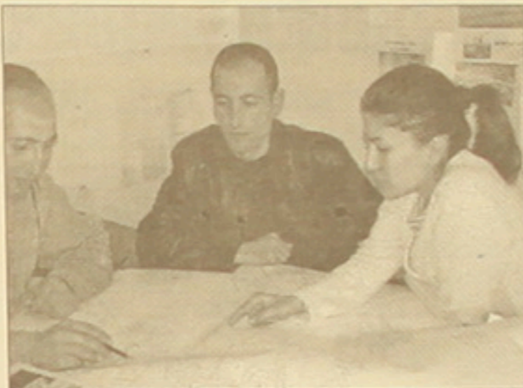
Կանցակցի է այդ փորձարկումներում սեղանի վրա աշխատանքների սեխնոլոգիկական ստացում:

2001-ին Գերմանիայի Դաշնությունում համադաստիան ուսուցում անցած «ԶԻՆԶ»-ի մասնագետները իրականացրել են Երևան ֆաբրիկայի խմելու ջրի վարակազերծման փորձարկումներում փորձարկում համակար-