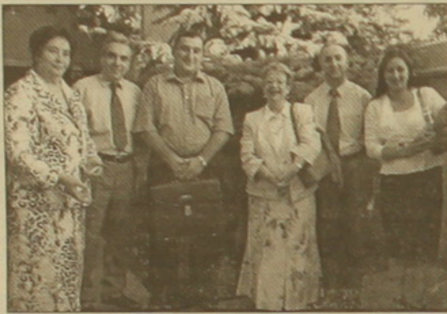
Բացի դրանից DAAD-ի հայաստանյան գրասենյակի միջոցով կարելի է սեղելություններ ստանալ այլ գերմանախոս կրթաթոշակային ծրագրերի մասին, ինչպիսիք են, օրինակ, համընդհանուր Copernicus կրթաթոշակային ծրագիրը, Բեռլինի Պասգամալոնների սան ուսումնական հիմնադրամը և այլն:

1999թ.-ից ի վեր DAAD-ը խրախուսում է նաև գերմանագիտության զարգացումը Հայաստանում, մասնավորապես՝ գերմանախոս դասախոսի մշակման ներկայությամբ և գերմաներեն դասավանդող դասախոսների համար կազմակերպվող սեմինարներով, Երևանի Պետական համալսարանի և Վ. Բրյուսովի անվան Պետական լեզվաբանական համալսարանի գերմանական բանասիրության ամբիոնների ու Մանհայմի գերմաներեն լեզվի ինստիտուտի և գերմանական լեզվաբանության ամբիոնի միջև միջբուհական համագործակցության օժանդակմամբ: