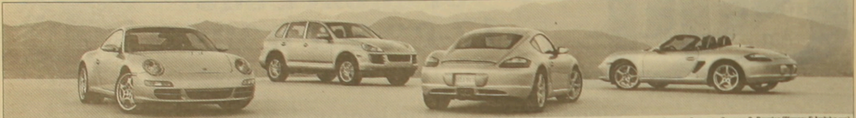
Carrera, Cayenne, Cayman S, Boxster (նկարում ձախից աջ)