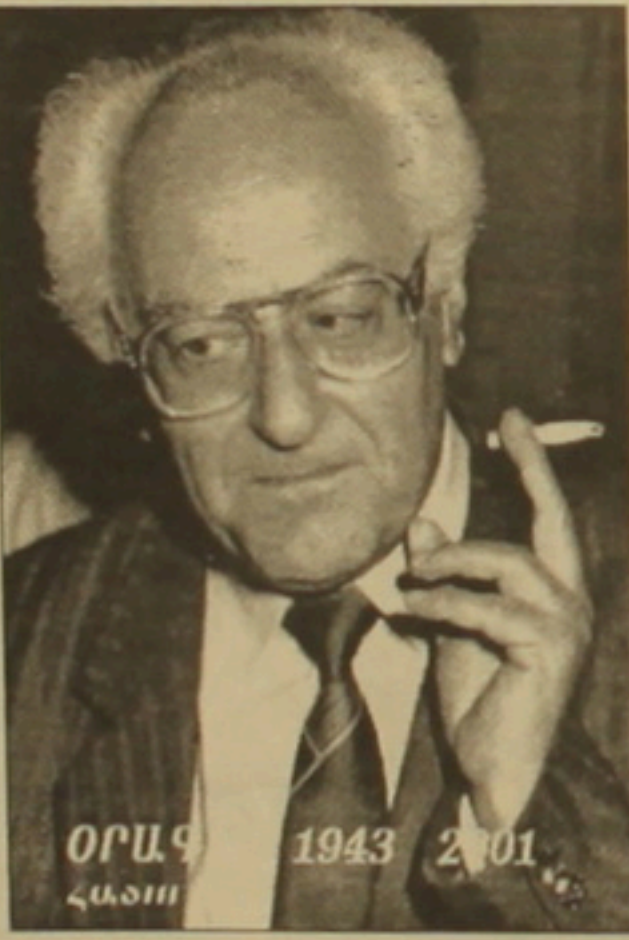
Այո, «ինչ հետո մութն է իջնելու այս խաղաղության վրա, բայց վաղը կրկին ծագելու է արեւը», այո, վաղը նոր օր է բացվելու եւ, այո, վաղը կրկին ծագելու է արեւը...

Այստեղ արեւն, ահա, արեւն իջավ Թեղեմիսի ետեւ, մասերնին մարեց իր հակնթերի փայլը, իրկանային հովից մեղմ թրթռաց։ Իսկ լեռնադաշտերի ամբողջ խաղաղ հեռասանը դեռ լուսավոր է այնտեղ՝ մայրամուտի արեւից թունդ ծիրանազույն դարձած։ Մայրամուտի արեւ։ Դա էլ իր խորհուրդն ունի, հայրիկ, ինչպես արեւույնի արեւը, որի խորհուրդն էր ցույց տալիս ինձ մանկությանս։ Զինչ հետո մութն է իջնելու այս խաղաղության վրա, բայց վաղը կրկին ծագելու է արեւը...»։