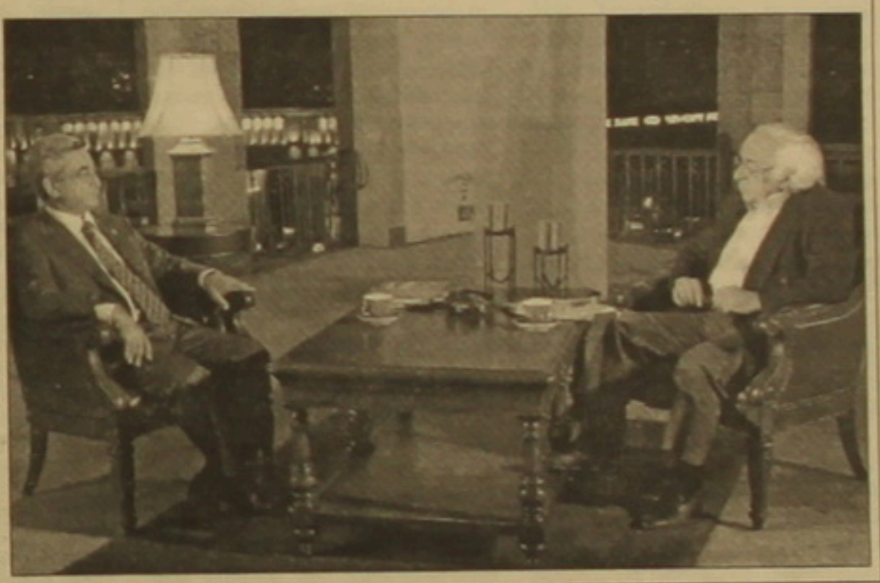
Sbu էջ 5

- Բարի երեկո դարձն վարչապետ: Ես իսկապետ տղավորված եմ այս արագ արձագանքում: Երբ տղազում էի հողվածը, չէի կարծում, որ Դուք այդքան արագ կարճազանքի, կընդառնեք, որոշեցի հարցերին դասասխանել, այն էլ հրատարակվել, որի համար ես շնորհակալություն եմ ուզում հայտնել իմ եւ ընթերցողների կողմից: Եվ ասեմ, որ մենք, մեր մանուկը սրան այնքան էլ սովոր չենք: Դժբախտաբար, երբեմն մենք գում ենք, մենք ասում մենք լսում: Ըստ-Ըստերը չեն ընդառնալով մամուլին: Ի՞նչը Ձեզ մղեց, որ կոնկրետ այս դարձապետ ընդառնեք եւ հարցազրույցի, եթե կարելի է ասել, ձեռնոցը վերցնեք: - Արձագանք, կարծում եմ, ըստ բնական է: Դուք Ձեր հողվածում հարցնում ե՞ք գիտի, արդյո՞ք, Սերժ Սարգսյանը: Ուզում եմ ասել, որ՝ այո, դարձն Ավետիսյան, գիտեմ եւ, կներեմ, Դուք մուսուխակ չեք դասկերացնում, թե ինչն է ինչը: Ինչպե՞ս խոսքայնք գիտեմ ես մեր երկրի ղեկավարները: Ինչո՞ւ հրատարակվել՝ որովհետեւ համարում եմ, որ եթե մարդիկ, ֆաղաֆաղները տեսնում են, համոզված եմ, որ դեկավարը՝ լինի վարչապետ, նախարար, թե ավագ մասնագետ, գիտի ղեկավարների մասին, գիտի լուծման ձեռքի մասին, ապա մի տեսակ վստահություն է ձեռավորվում, այսինքն՝ ձեռավորվում է մի միջավայր, որն օժանդակում է այդ խնդրի լուծմանը: Սա է նպատակը: