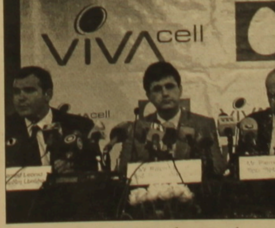
Sbu էջ 2

«2 ամիս առաջ հայտնել էինք, որ «Վիվասել» համար «փեսացուներ» ըստ կան եւ հայտնի չէ, թե նա ում հետ կամուսնանա: Այսօր հայտնում ենք, որ դա MTS ընկերությունն է», այսպես սկսեց երկու հրավիրված մամուլի ասուլիսը «Ֆաթրուզ գրույթի» սեփականատեր Պիեռ Ֆաթրուզը, փաստորեն հաստատելով մեր թերթի երկվա համարում տղազրված տեղեկությունը, որ ընկերությունն արդեն վաճառվել է: Նրան հաջողեց MTS-ի նախագահ Լեոնիդ Սելյանովը, գոհունակություն հայտնելով: Իր ղեկավարած ընկերության մեջ է մտնում որակյալ աշխատուժով, բարձր որակի կադր մասնակարարող եւ գոհ բաժանորդներ ունեցող «Վիվասելը»: Այնուհետեւ նա անդրադարձավ MTS-ի գործունեությանն ու նպատակներին: