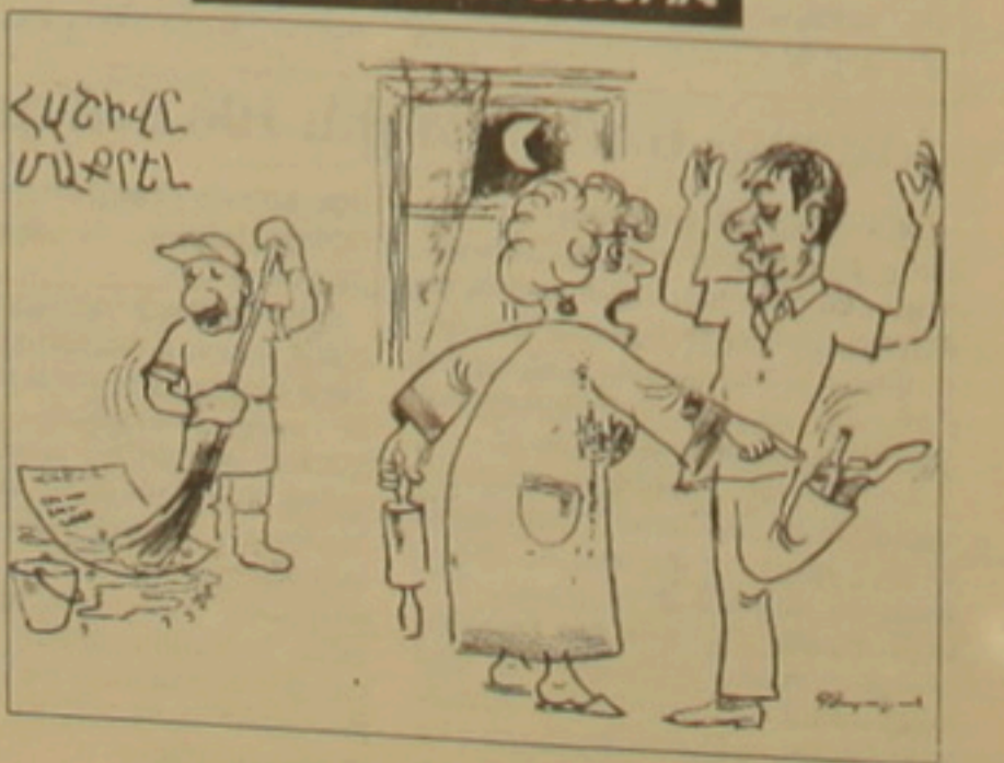
ՀՎԵՒԸ ԵՎ ԵՆԻՆ