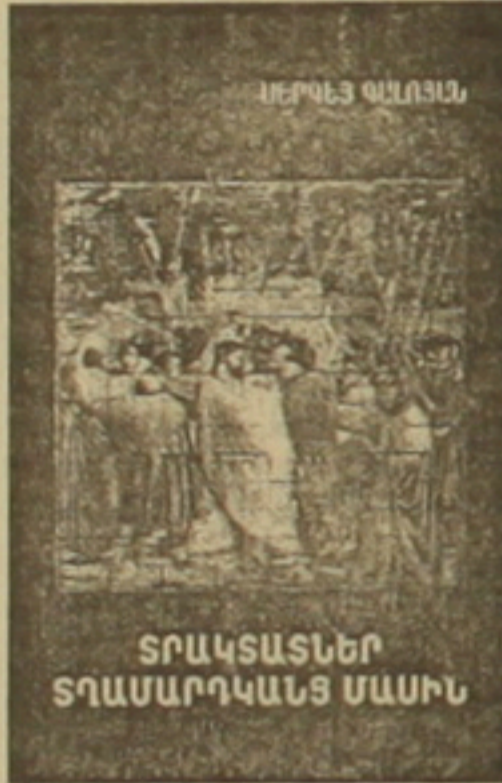
ՏՐԱԿԱՍՆԵՐ ՏՂԱՄԱՐԴԿԱՆՑ ՄԱՍԻՆ

հանգրվան են վայելում: Այս գրքերի հաջողությամբ լույս աշխարհ գալը, անուշուշ, լայնամակուրված է ժամանակի ընթացում հեղինակի կատարած արվեստի փաստաթղթային ուսումնասիրություններով, դասնագրական, գեղարվեստական-հրատարակչական բազմաթիվ աղբյուրներից, նաև ինտերնետային կայքերից սարկների հավաքական համարդական-թարգմանական աշխատանքներով: