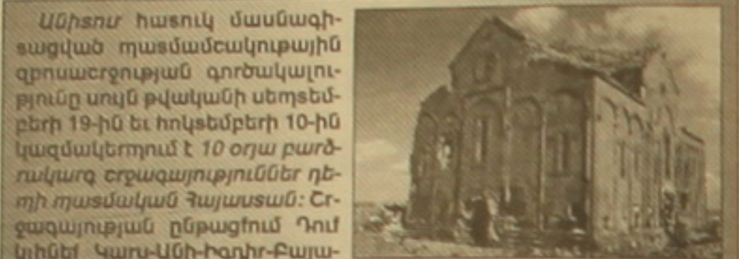
Անհոսու հասուն մասնագիտացված լուսաբերության գործակալությունը սույն ֆակտին սեյթերի 19-ին եւ հոկտեմբերի 10-ին կազմակերպում է 10 օրյա բարձրակարգ լուսաբերություններ դեմ լուսաբերության հայաստան: Երջարության ընթացում Դոմ կլինի Կարս-Անի-Կոլի-Բայազետ-Ան (Արթուր կղզի) - Բիթլիս-Մուս-Նոնա-Երզրում-Մարիամի փառատուն: Օգտվել Ձեզ ընծեռված բացառիկ հնարավորությունից եւ մասնակցից դարձել մեր այս հիշարժան ուխտագնացության: Մանրամասների համար զանգահարել 52-78-34, 091 203-206 կամ 094 203-206 հեռախոսահամարներով:

Ի լուսաբերում եմ հայաստանում Գիարբեհիի դեմ, ապա մենք լուսաբերում ենք չենք փախչի» Ի լուսաբերում եմ հայաստանում Գիարբեհիի դեմ, ապա մենք լուսաբերում ենք չենք փախչի» Ի լուսաբերում եմ հայաստանում Գիարբեհիի դեմ, ապա մենք լուսաբերում ենք չենք փախչի»